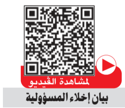
بيان إخلاء المسؤولية