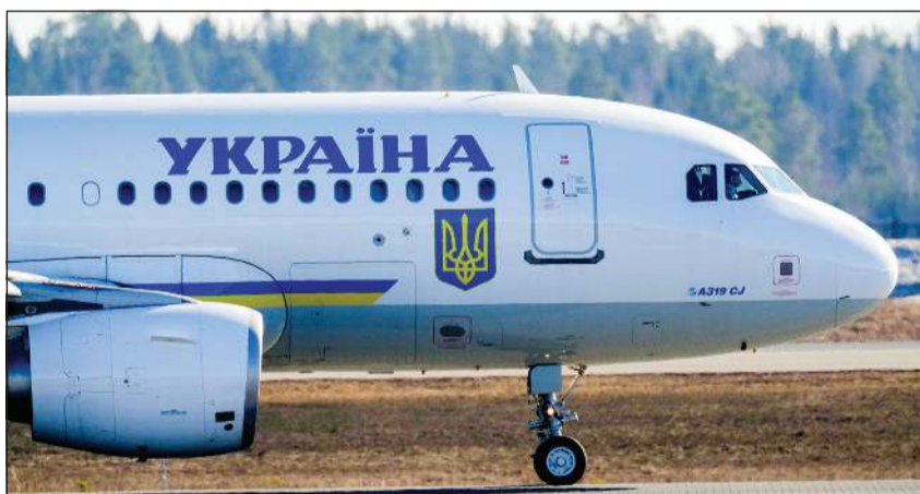
طائرة الرئيس الأوكراني فولوديمير زيلينسكي تحط في مطار غارمون في الترويج

السعودية، فيما أفاد المتحدث باسم الكرملين دميتري بيسكوف - بشأن المحادثات الأميركية - الروسية «قد لا تتم يوم الأحد». ويتم الاتفاق على التفاصيل الدقيقة. قد تكون مطلع الأسبوع المقبل». وقال والتر إن «فرقا فنية» من روسيا والولايات المتحدة ستجتمع في الرياض للتركيز على تطبيق وتوسيع وقف إطلاق النار الجزئي الذي ضمنه الرئيس ترامب من الجانب الروسي». وذكرت موسكو أن روسيا وأوكرانيا تبادلتا 372 سجيناً، في بادرة حسن نية بعد اتصال ترامب وبوتين. لكن كيف وموسكو تبادلتا الاتهامات بمواصلة الهجمات وقالت روسيا إنها دمرت 132 مسيرة أوكرانية في هجمات ليلية في مناطق عدة من البلاد. ففي هجوم أسفر عن إصابة شخصين وتسبب في نشوب حريق في قاعدة جوية عسكرية بحسب السلطات. وأفادت أجهزة الطوارئ الأوكرانية أمس بأن مسيرات روسية استهدفت أبنية سكنية في كرويفيتسكي في وسط أوكرانيا، ما أدى إلى وقوع قتلى وجرحى.