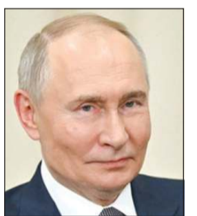
الرئيس الروسي فلاديمير بوتين

أكد بيسكوف أن بوتين شدد في رسالته دعم موسكو لجهود الرئيس الشرع الهادفة إلى تحقيق الاستقرار في سورية. وأشار إلى أن الرسالة شددت على أهمية تسريع خطوات استقرار الأوضاع في سورية، بما يضمن سيادتها واستقلالها ووحدتها وسلامة أراضيها. وأضاف أن بوتين جدد في رسالته التزام روسيا بتعزيز التعاون العملي مع القيادة السورية بمختلف القضايا ذات الاهتمام المشترك، في إطار توطيد العلاقات الودية التقليدية بين البلدين.