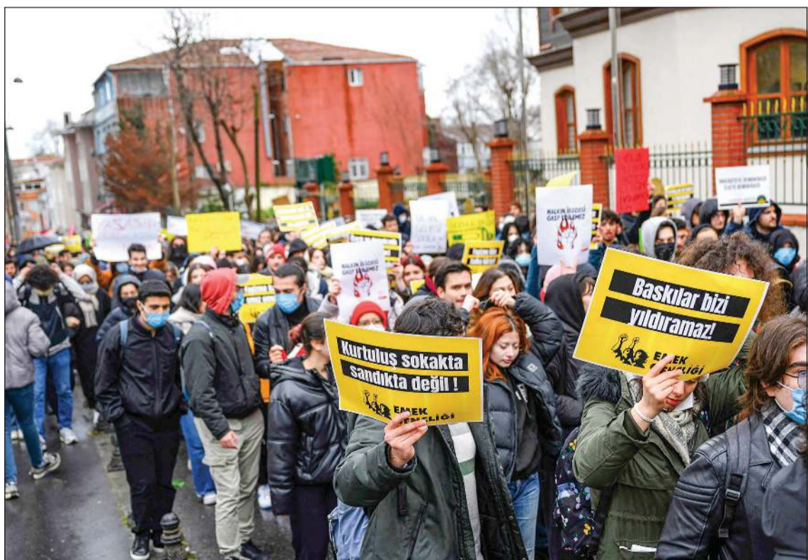
طلاب يتظاهرون ضد قرار جامعة إسطنبول إلغاء شهادة رئيس بلدية المدينة أكرم أوغلو

إسطنبول - وكالات: أعلن مكتب المدعي العام في إسطنبول أن السلطات تحفظت على شركة البناء المملوكة بشكل مشترك لرئيس بلدية إسطنبول المعتقل أكرم أوغلو، فيما دعا حزبه إلى مزيد من الاحتجاجات في أكبر مدينة تركية. وأوضح المكتب في بيان أن التحفظ على شركة (إمام أوغلو للإنشاءات والتجارة والصناعة) تم بناء على قرار من محكمة استنادا إلى تقارير التحقيق في جرائم مالية. وقالت وسائل إعلام تركيا أنه جرى أمس استجواب رئيس بلدية إسطنبول الكبرى والمشتبه بهم الآخرين، وذلك في إطار التحقيقات الجارية بشأن «الفساد» و«الارتباط بمنظمات إرهابية». ويأتي ذلك بعد يوم من اعتقال الشرطة التركية أمام أوغلو، الذي يعد المنافس الرئيسي للرئيس التركي رجب