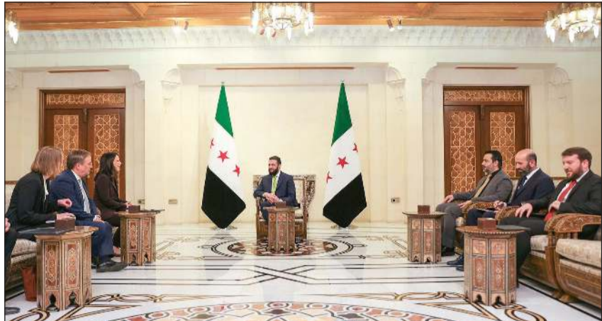
الرئيس أحمد الشرح مستقبلا الوفد الألماني على رأسه وزيرة الخارجية أنالينا بيربوك ونائب رئيس البرلمان الأوروبي آرمن لاشيت

عواصم - وكالات: استقبل رئيس الجمهورية أحمد الشرح ووزير الخارجية أسعد الشيباني وفدا من ألمانيا الاتحادية على رأسه وزيرة الخارجية أنالينا بيربوك ونائب رئيس البرلمان الأوروبي آرمن لاشيت في دمشق. وقامت بيربوك رسميا بإعادة افتتاح السفارة الألمانية في دمشق بعد إغلاق دام 13 عاما. وقامت بيربوك بجولة في حي جوبر المدمر بالكامل خلال زيارتها الثانية إلى العاصمة السورية منذ سقوط نظام الرئيس المخلوع بشار الأسد. وقالت بيربوك في تصريحات صحافية من دمشق إن «المصالحة في سورية مطلوبة الآن لتتحول آمال وتوقعات الناس إلى واقع»، ودعت «الجميع إلى ممارسة أقصى درجات ضبط النفس وعدم تفويض المصالحة الداخلية السورية». واكدت ان «التدخل الأجنبي في سورية لم يجلب في الماضي سوى الفوضى، ومستقبل البلاد يجب أن يقرره السوريون بأنفسهم وبقرارهم السيادي». واعبرت أن «مهمة الحكومة الانتقالية السورية تحت قيادة أحمد الشرح ستكون شاقة، لكن من الضروري أن تكون هناك