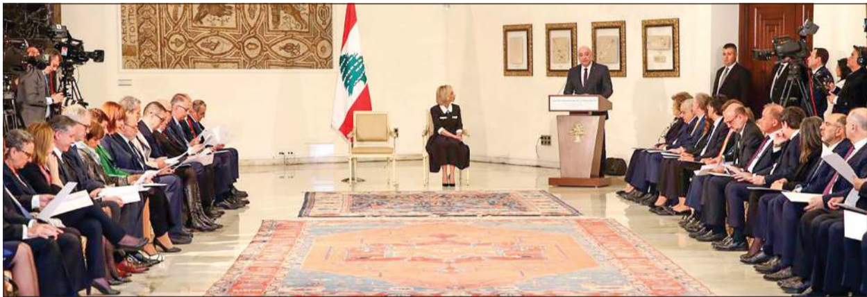
الرئيس العماد جوزيف عون يلقي كلمة في اليوم العالمي للفكرتقونية

بيروت - ناجي شربل وأحمد عز الدين نجحت المساعي في نزع فتيل التفجير على الحدود الشمالية الشرقية للبنان مع سورية من خلال انتشار الجيش اللبناني في البلدات الحدودية التي شهدت مواجهات، وإفقال عدد من المعابر غير الشرعية التي تستخدم للتهريب من الخارجين على القانون على طرفي الحدود، إلى سحب السلاح من بعض المجموعات، رغم احتجاجات أصحاب المصالح والمصطادين في «المه العكرة».