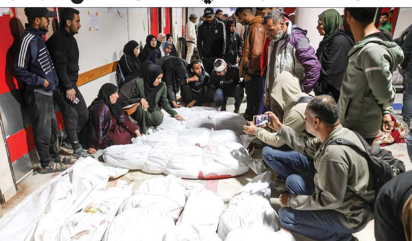
جثث ضحايا الغارات الجوية الإسرائيلية في شمال قطاع غزة أمام المستشفى الإندونيسي في بيت لاهيا