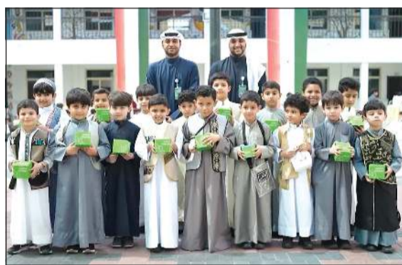
فعاليات القرقيعان في المدارس

إفطار الصائمين بمختلف أنحاء الكويت بواقع 30 ألف وجبة تقريبا خلال الشهر الفضل. ويضم البرنامج فعاليات رياضية وصحية متنوعة لجميع الفئات العمرية لتشجيع على ممارسة الرياضة والتوعية بأهمية الصحة على الفرد والمجتمع، بالإضافة إلى دورات لتعليم الطبخ لعميلات وموظفات البنك مع أشهر الطهاة في الكويت لتعزيز مفهوم التغذية المنزلية الصحية. وللمعام الثاني عشر على التوالي ينظم بيت التمويل الكويتي مسابقة تلاوة القرآن الكريم الرمضانية «مسابقة قرآء بيت التمويل الكويتي» الأولى من نوعها على مستوى الكويت، والتي تشهد إقبالا كبيرا في كل عام من جميع الشرائح العمرية.