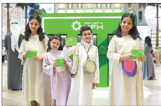
قرقيعان بيت التمويل الكويتي في «الافنيون»