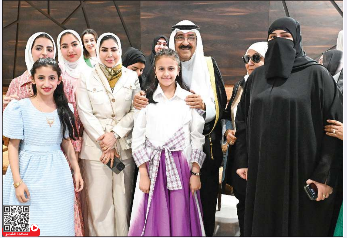
صاحب السمو الأمير الشيخ مشعل الأحمد متوسلاً إحدى الأسر خلال زيارة سموه إلى جمعية المكفوفين الكويتية

صاحب السمو قام بزيارة إلى النادي الكويتي الرياضي للمعاقين وجمعية المكفوفين الكويتية