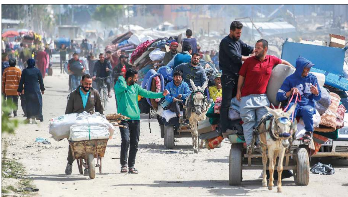
فلسطينيون يحملون ما يمكن من أمتعتهم وينزحون من بيت حانون شمال قطاع غزة هرباً من القصف الإسرائيلي

وقال لوكالة «فرانس برس» أمس إن «حماس» لم تغلق باب التفاوض، ولا حاجة إلى اتفاقات جديدة في ظل وجود اتفاق موقع من كل الأطراف». وأضاف «لا شروط لدينا، لكننا نطالب بالزام الاحتلال بوقف العدوان وحرب الإبادة فوراً، وبدء مفاوضات المرحلة الثانية، وهذا جزء من الاتفاق الموقع». التفاصيل ص 17