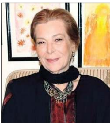
المسلسل الخليجي «أولاد بوجاسم».

كانت على يد مكتشفها نبيل المالح الذي راعه كاريزما السحر والأثونة في وجه الشابة نبيلة، فعرض عليها التمثيل في فيلمه «المخاض» من ثلاثية فيلم «رجال تحت الشمس»، عن رواية مسيرة الأعمال السينمائية لتعمل مع مخرجين من سورية ومصر ولبنان. ونجحت النابلسي بالخروج بها من دائرة التنميط بالأعمال الدرامية وقدمت «الأربعاء» و«الحور العين» ومسلسل «أحقاد خفية» ومسلسل «لميس سرايا» الذي كان آخر ما قدمته قبل أن يقبدها المرض في بيتها نحو عامين.