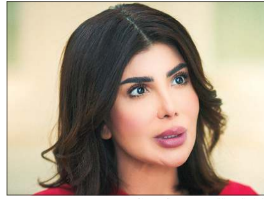
إلهام الفضالة في شخصية «جميلة»