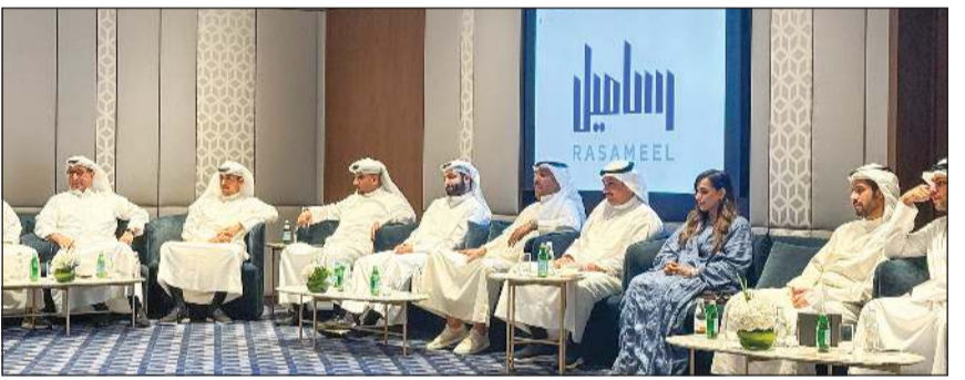
جانب من الحضور خلال الغيبة الرمضانية لشركة رساميل للاستثمار