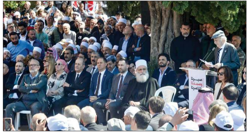
رئيس حزب التقدمي الاشتراكي السابق وليد جنبلاط يلقي كلمة في ذكرى اغتيال والده كمال جنبلاط بحضور شيخ العقل سامي أبي المتى والنائب تيمور جنبلاط ورئيس حزب الكتائب سامي الجميل (محمود الطويل)