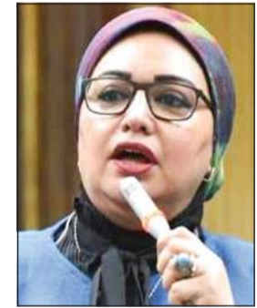
النائبة سولاف درويش