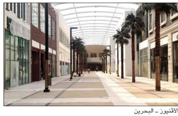
الأفنيوز - البحرين