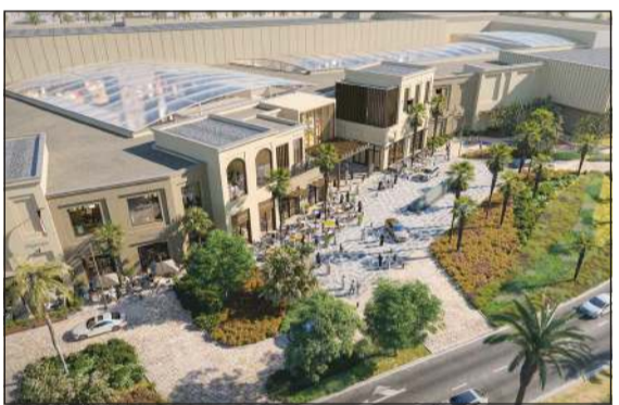
سوق صباح في مدينة صباح الأحمد السكنية