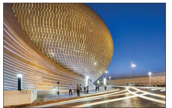
الأفنيوز - الكويت

خلال 2024.. وتوصية بتوزيع 13٪ أرباحاً نقدية و3٪ أسهم منحة