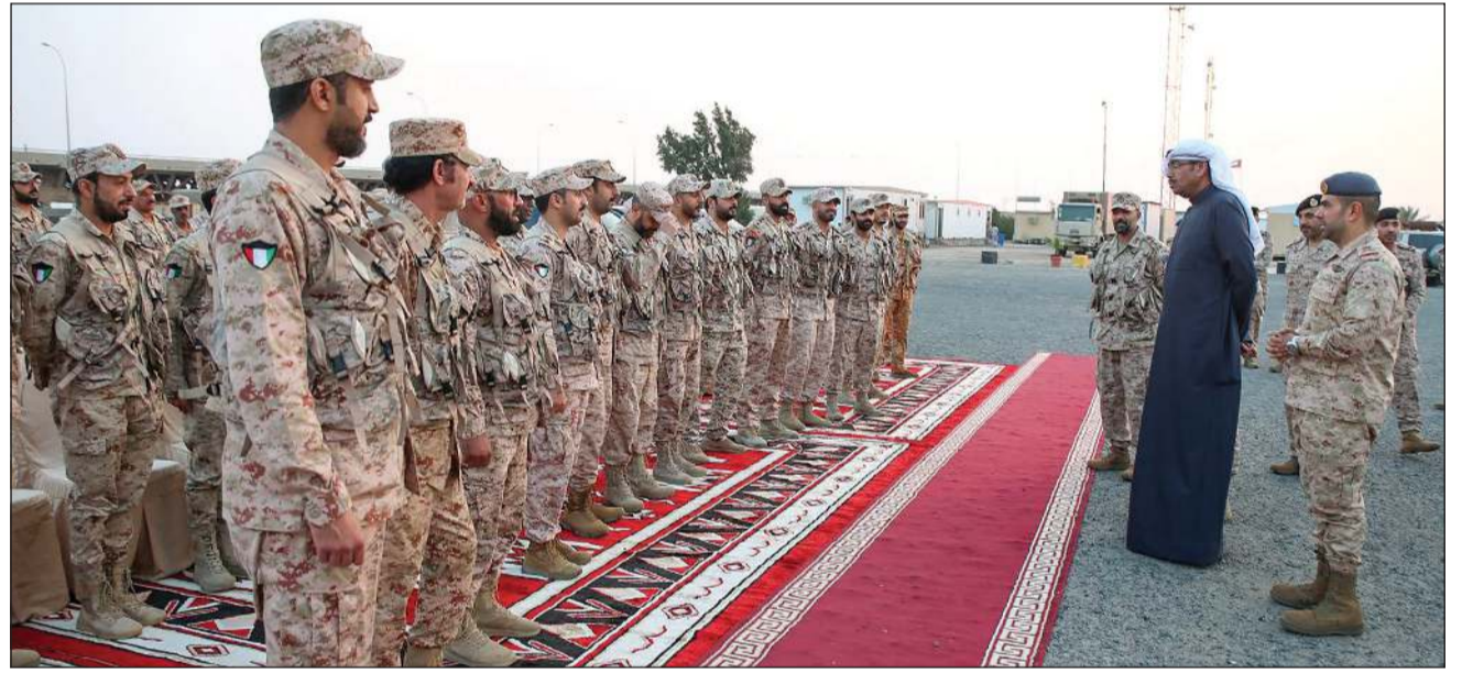
وزير الدفاع ووزير الداخلية بالإذابة الشيخ عبدالله العلي لدى زيارته قوة «واجب مبارك» بالمنطقة الشمالية برفاقه نائب رئيس الأركان العامة للجيش اللواء الركن طيار الشيخ صباح الجابر

أكد مصدر بالهيئة العامة لشؤون ذوي الإعاقة أن جميع اللجان الطبية بالهيئة تعمل بشكل منتظم خلال شهر رمضان المبارك وفق الدوام المحدد لعملها من الساعة 12:30 إلى 2:30 يومياً خلال أيام العمل الرسمي ولا يوجد أي تأخير أو تأجيل في المواعيد أو إصدار تقرير اللجان. وأشار إلى أن الهيئة عقدت اجتماعاً فنياً بشأن الكراسي المتحركة، كاشفاً عن أنه من المتوقع بدء توزيعها قريباً. كما بين المصدر أن الهيئة تجري دراسة متكاملة بشأن إعادة النظر في كل المعايير الخاصة بتصنيف الإعاقات بما يتماشى مع بنود الاتفاقية الدولية لذوي الإعاقة. وحول أعداد ذوي الإعاقة المسجلين بالهيئة، أوضح المصدر أن هناك ما يقارب الـ 69 ألف مسجل بالهيئة من جميع فئات الإعاقات، الأعلى «الذهنية» بـ 18250 حالة، تليها «الحركية» بـ 15010 حالات، ثم «الجنسية» بـ 11834 حالة، و«التعليمية» بـ 7709 حالات، و«السمعية» بـ 5348، و«النفسية» بـ 2465، و«التطويرية» بـ 1905 حالات، و«غير المحددة» بـ 500.