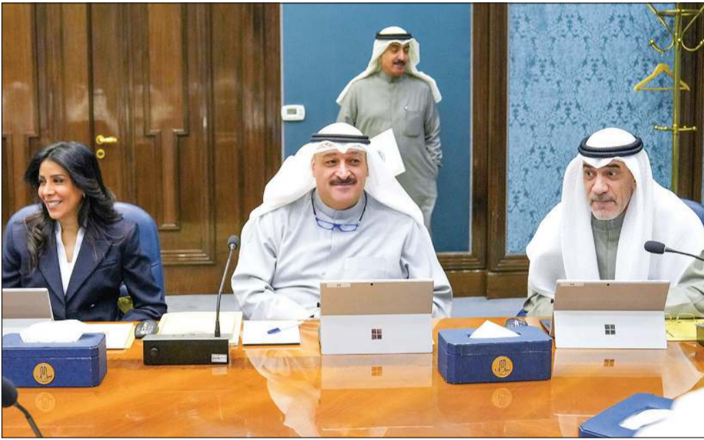
رئيس الوزراء بالإذابة الشيخ فهد اليوسف ود.أحمد العوضي ود.ثورة المشعان خلال اجتماع مجلس الوزراء

ولا يوجد شيء يخص الجنسية الكويتية لن يفتح». وأشار إلى «أن المادة الخامسة بها عدة فقرات سيتم فتحها، والمادة السابعة بها عدة أمور خاصة بالرجال وعدة أمور خاصة بالنساء وكلها سيتم فتحها». وشدد اليوسف على أن الكويت مرت بمرحلة - أن شاء الله - لا تمر بها مرة ثانية» مؤكداً أنه مستمر على النهج الذي يسير عليه، ولكن كل الأمور تحتاج إلى وقت وليس عملية سهلة أن تعمل في كل الأمور. كما أعلن «أن تعديل مواد الجنسية سيفتح، ولن نعلم إنساناً أخذ حقاً هو أصلاً مو حقه». وفيما يخص لجنة التظلمات، أكد اليوسف أن «اللجنة شكلت من خيرة الناس الذين ينظرون في هذه الأمور، وأن شاء الله ما تكون ظلمنا أحداً، وما تقرر اللجنة فإننا مستعدون للنظر فيه مرة أخرى».