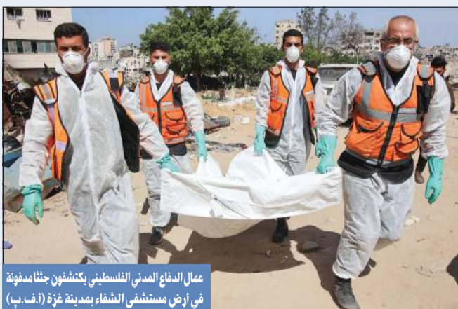
عمال الدفاع المدني الفلسطيني يكشفون جثثاً مسمومة في أرض مستشفى الشفاء بمدينة غزة

عواصم - وكالات: أكدت لجنة تحقيق مستقلة تابعة للأمم المتحدة، أمس، أن إسرائيل ارتكبت أعمال إبادة جماعية وانتهاكات بحق الفلسطينيين في جميع الأراضي المحتلة منذ 7 أكتوبر. وقالت اللجنة خلال جلسات الاستماع العامة بجنيف، إن الجيش الإسرائيلي لديه خريطة للمرافق الصحية وأختصاصاتها، وقد تم تدميرها بطريقة متعمدة، وأكدت اللجنة أن لديها أدلة على شن الهجمات الإسرائيلية بشكل متعمد على مؤسسات ومرافق صحية، وأشارت إلى أن هناك تجاهلاً وإنكاراً من المجتمع الدولي لما يحصل من انتهاكات بحق الفلسطينيين. كما أنه يتم الاعتداء على السجناء الفلسطينيين جسدياً ونفسياً بشكل يهين كرامتهم. وأضافت اللجنة أن أي طفل يولد اليوم في غزة يواجه خطر الموت. في المقابل دان رئيس الوزراء الإسرائيلي بنيامين نتنياهو