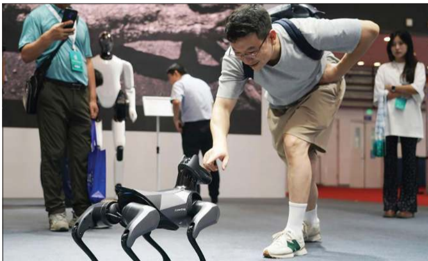
صورة أرشيفية لرائد يتفاعل مع كلب آلي في المؤتمر العالمي للروبوتات 2023 في بكين

وهو مجهز بكاميرا متعددة الأطياف وكشافات على رأسه، بينما يسمح التصميم الخلفي لهذه الكلاب الروبوتية بالتركيب السريع للمعدات المتخصصة مثل المعدات المقاومة للانفجار، وأجهزة الكشف عن الغاز، مما يمكنها من التعامل مع مجموعة متنوعة من المهام بمرور