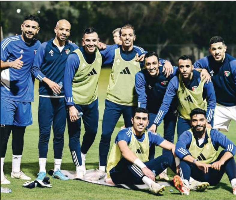
لاعبو «الأزرق» خلال تدريب أمس الأول على ملعب شباب الأهلي