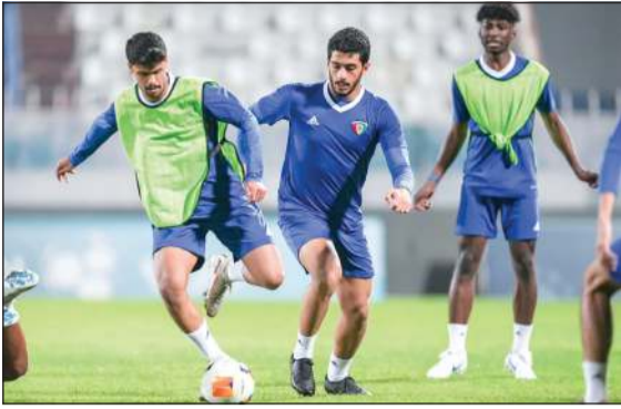
جانب من تدريبات منتخبنا الأولمبي