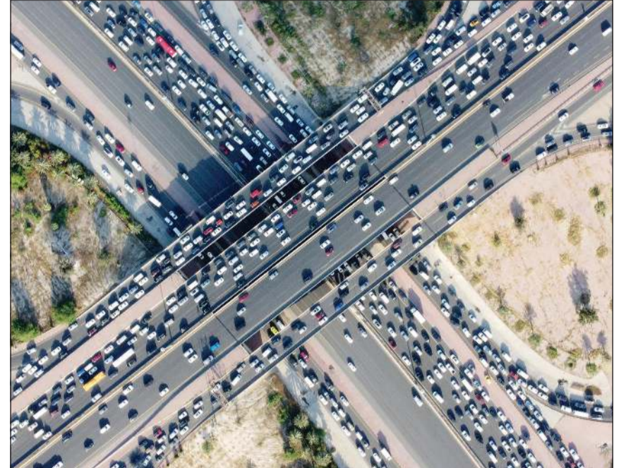
الازدحام المروري في الكويت تقع مسؤوليته بنسبة كبيرة على السلوكيات المخالفة لقانون المرور

كاميرات الذكاء الاصطناعي والبصمة البيومترية في تحديد شخص مخالف استقلال مركبة صديقه أو أسرته دون أن تنزل المخالفة على مالك المركبة، قال الصبحان: صاحب المركبة هو من تنزل عليه المخالفة، وفي حال الاعتراض عليه أن يقدم وباتني بمن كان مستقل المركبة وقت المخالفة كونه المسؤول حسب القانون عن السيارة، مشيراً إلى أن هناك سيدة تشتكي لوجود مخالفات تقدر بـ 30 ألف دينار عليها، حيث أبلغت بأن المركبة كانت في عهدة ابنها، وتم إحضار الابن فطلب منه أن يحدد هوية من كانوا يستقلون المركبة، فقال إن أصدقاءه هم من كانوا يستقلونها ويرتكبون بها المخالفات ولم يأت باي من أصدقائه.