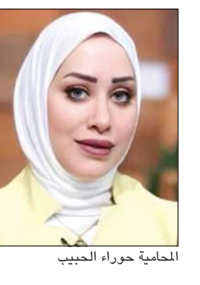
الحامية حوراء الحبيب

المال السياسي خلال استجواب النائب السابق مهلهل المصطفى لسمو الشيخ أحمد النواف. وكانت النيابة العامة أسندت للمتهم بتاريخ 2023/11/27 بائحة جهاز أمن الدولة تهمة إشاعة كاذبة ومغرضة حول الأوضاع الداخلية للبلاد ببرنامج التواصل الاجتماعي (إكس) لكافة