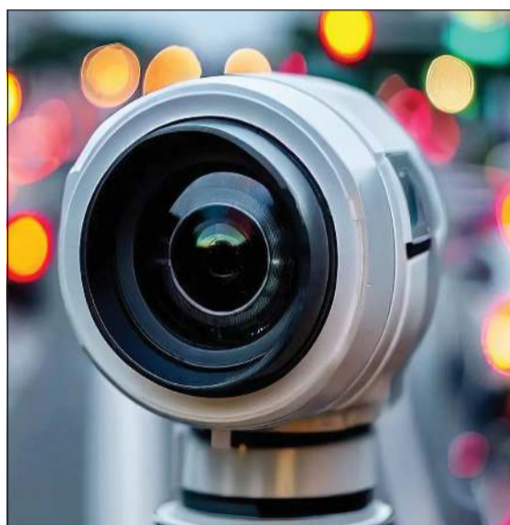
أنواع متعددة من الكاميرات الذكية تم تعميمها في عموم دولة الكويت

المخالفة على المالك وحول إمكانية استخدام