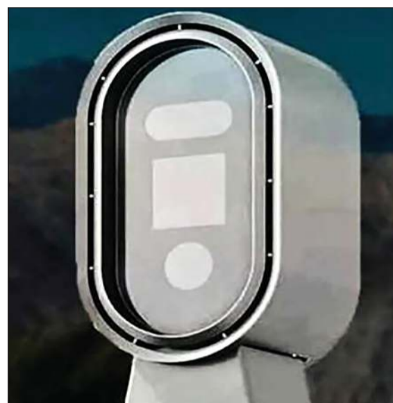
أنواع متعددة من الكاميرات الذكية تم تعميمها في عموم دولة الكويت

كثيرة بسبب استخدام الهاتف النقال باليد، مؤكداً أن أسابيع المرور بين مجلس التعاون الخليجي ممتدة منذ عام 1984، لافتاً إلى أن هذه الأسابيع كانت لها ثمارها على أرض الواقع بتغيير سلوكيات مستخدمي المركبات. وحول إمكانية توحيد المخالفات بين دول مجلس التعاون الخليجي، قال: الآن هناك تقارب في قيمة الغرامات بين دول المجلس، إذ على سبيل المثال يدفع المخالف لتجاوز الإشارة الحمراء في دولة قطر الشقيقة 6000 ريال قطري، وفي المملكة العربية السعودية أيضاً المخالفة 6000 ريال أي ما يعاد 500 دينار كويتي، وأيضا تقدر قيمة المخالفة ذاتها في دولة الإمارات العربية الشقيقة 50 ألف درهم، وهذا التخليط يصعب في صالحه