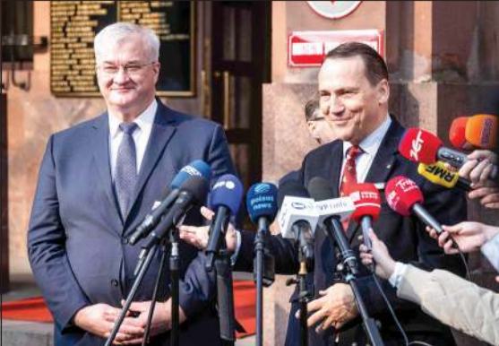
وزير الخارجية البولندي رادوسلاف سيكورسكي في مؤتمر صحفي مع نظيره الأوكراني أندريه سيبيغا في وارسو

عواصم - وكالات: أكدت وارسو أمس أن المساعدات العسكرية المرسله إلى أوكرانيا عبر بولندا عادت إلى مستوياتها السابقة، وذلك غداة إعلان وزير الخارجية الأميركي ماركو روبيو من مدينة جدة السعودية موافقة أوكرانيا على مقترح أميركي بإيقاف قوري لإطلاق النار لمدة 30 يوماً واتخاذ خطوات نحو استعادة السلام الدائم. وكانت الولايات المتحدة علقت مساعداتها إلى أوكرانيا الأسبوع الماضي، إثر مشادة كلامية حادة بين الرئيسين دونالد ترامب وفولوديمير زيلينسكي في البيت الأبيض. لكن البلدين عقدا مباحثات في جدة، أعلنت في ختامها أوكرانيا موافقتها على مقترح أميركي بهدنة ثلاثين يوماً في الحرب مع روسيا،