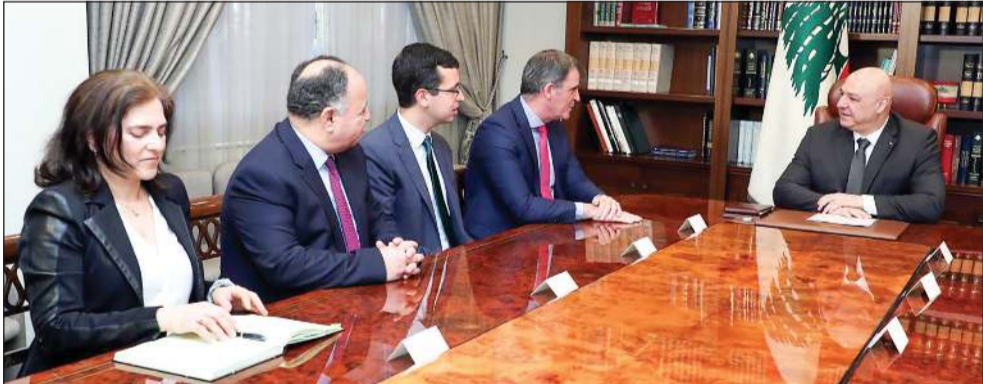
الرئيس العماد جوزف عون مستقبلاً رئيس بعثة صندوق النقد الدولي إرنستو راميريز ريفو في قصر بعيدا

بيروت - ناجي شربل وأحمد عز الدين نجحت الجهود اللبنانية في تحقيق بعض الإيجابيات، من خلال تحريك القوى الدولية، خصوصاً الولايات المتحدة وفرنسا، وهما الدولتان اللتان تشرفان على تنفيذ اتفاق وقف إطلاق النار، وترجم هذا التحرك بعقد اجتماع استثنائي ومنتج للجنة الإشراف برئاسة الجنرال الأميركي جاسبر جيفرز، مباشرة بعد لقائه رئيس الجمهورية العماد جوزف عون في قصر بعيدا بحضور سفيرة الأميركية ليزا جونسون. وجاءت الخطوة كتعبير عن إرادة عواصم القرار. وقد جرى التركيز على ثلاثة عناوين، هي: الانسحاب الإسرائيلي حتى الخط الأزرق الذي يمثل الحدود الدولية مع التحفظات القائمة حول النقاط الـ 13 الخلفية، وثانياً تشكيل لجان خاصة لمعالجة هذه النقاط من أجل التوصل إلى اتفاق نهائي حول الحدود البرية، كما حصلت في موضوع الحدود البحرية الخلفية الليطاني، في ظل استمرار الخروقات، وسط حالة غضب واسعة