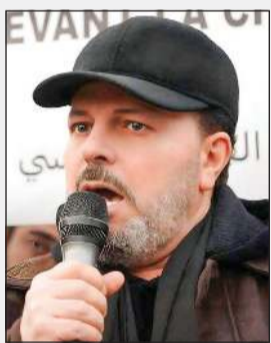
السيرف السوري الراحل نور الدين اللباد

وكالات: اغتال مسلحون مجهولون السفير السوري المنشق نور الدين اللباد وشقيقه في إطلاق نار على منزل السفير في مدينة الصنمين بريف درعا جنوبي سورية، قبل أن يلوذوا بالفرار. وقال تلفزيون سوريا، إن المسلحين استهدفوا بالأعيرة النارية السفير السابق نور الدين اللباد وشقيقه عماد اللباد في الصنمين بريف درعا الشمالي. واللباد كان وزيرا مفوضاً في وزارة الخارجية السورية، وعمل في سفارات سورية، باليمن وفرنسا والعراق وتركيا وليبيا في وقت سابق، وانشق عن النظام عام 2013، والتحق بصقوف الثورة السورية، وعمل ممثلاً للاتحاد في فرنسا. وحمل اللباد شهادة الدكتوراه في الأدب الفرنسي ودبلوماً علياً في الترجمة والمجستير في العلاقات الدولية،