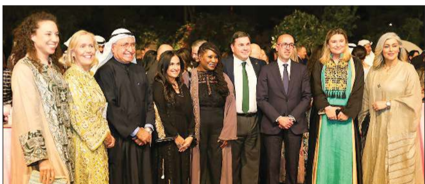
جانب من الحضور في غبقة السفارة البريطانية

وأضافت «نحتفي اليوم بقصص نجاح القيادات النسائية في قطاع الأعمال عبر الأجيال، ونؤكد التزامنا بدعم وتمكين الجيل القادم من النساء، وتعزيز الروابط الاقتصادية بين بلدينا». من جانبها، أوضحت سفيرة المملكة المتحدة لدى الكويت بليندا لويس، أن الغبقة هذا العام تأتي في إطار الاحتفال