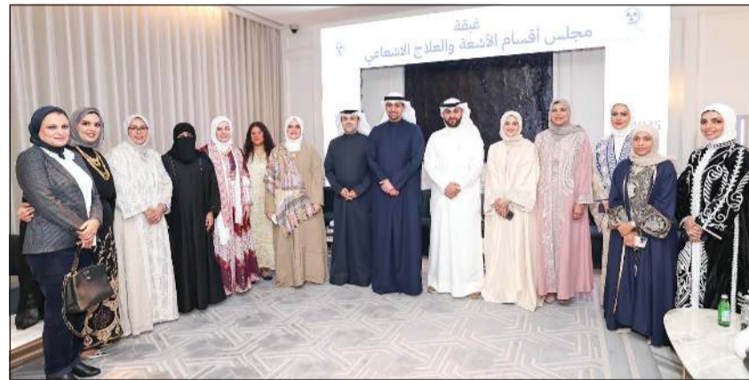
جانب من الحضور في الغبقة

نظم مجلس أقسام الأشعة غبقة رمضانية جمعت أطباء وفنيي الأشعة من مختلف المستشفيات، بحضور وزير الصحة د. أحمد العوضي، وذلك في أجواء ودية اجتماعية تعكس روح التواصل والتعاون بين العاملين في هذا المجال الحيوي، وتؤكد أهمية العمل الجماعي في تقديم رعاية صحية متكاملة.