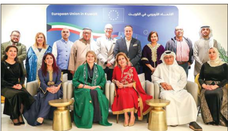
سفيرة الاتحاد الأوروبي لدى الكويت آن كويستين متوسطة ممثلي وسائل الإعلام خلال الغبقة الرمضانية

إضافة إلى استضافة الكويت منتدى الأعمال السنوي بين الاتحاد الأوروبي ودول الخليج بحلول نهاية 2025. وفي المجال الثقافي، أكدت كويستين على أهمية التبادل الطلابي والتعاون في التعليم العالي وتمكين المرأة، مشيرة إلى أن تسهيل متطلبات تأشيرة «شغن» للكويتيين يمثل أولوية بالنسبة لها، كما هنأت الكويت على اختيارها عاصمة للثقافة والإعلام العربي لعام 2025، مشيدة بمثانة الروابط الثقافية بين الكويت وأوروبا في مجالات