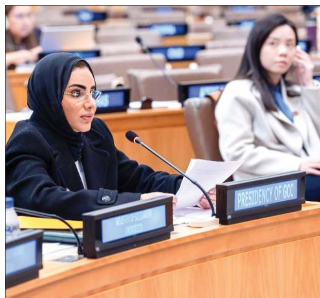
وزيرة الشؤون د. أمثال الحويلة تتلقى كلمتها خلال الاجتماع الوزاري الذي عقد على هامش الدورة الـ 69 للجنة وضع المرأة بالأمم المتحدة

أن الكويت ستواصل دعم المبادرات الإقليمية والدولية التي تسهم في تحقيق أهداف المساواة وتمكين المرأة في مختلف المجالات. واختتمت الحويلة كلمتها بالتأكيد على التزام الكويت بدعم السياسات الاجتماعية التي تحقق العدالة الاجتماعية وتمكين المرأة من الوصول إلى جميع الفرص الاقتصادية والاجتماعية تحقيقا لرؤية التنمية المستدامة 2030.