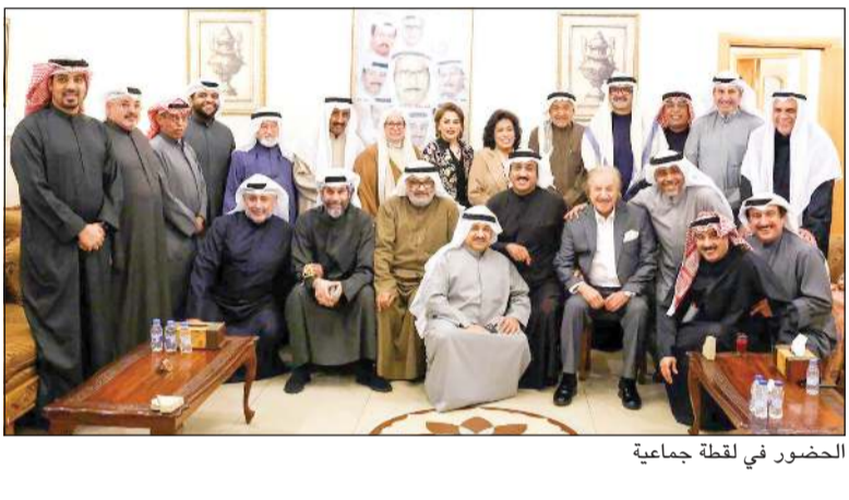
الحضور في لحظة جماعية

أقام الاتحاد الكويتي للإنتاج الفني والمسرحي غبقة الرمضانية السنوية في ديوان رئيسه الإعلامي والمحمي خالد الراشد، والكائن في منطقة الشهداء. حضر الغبقة مدير عام مؤسسة الإنتاج البرامجي المشترك لدول الخليج الشيخ مبارك فهد جابر الأحمد الصباح ونائب رئيس الاتحاد الكويتي للإنتاج الفني والمسرحي الفنانة القديرة حياة الفهد ورواد ونجوم الفن والإعلام والرياضة.