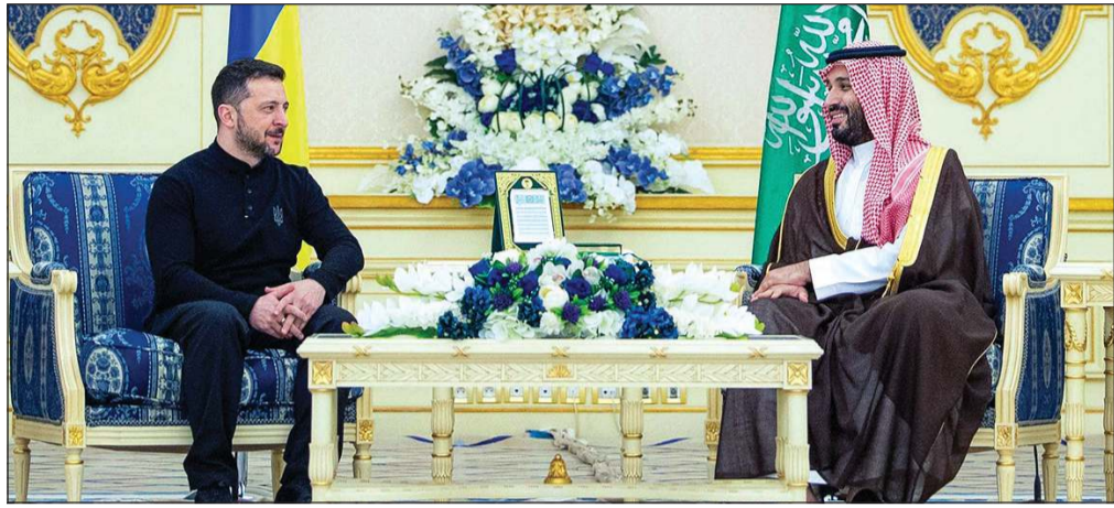
صاحب السمو الملكي الأمير محمد بن سلمان ولي العهد رئيس مجلس الوزراء السعودي مستقبلا الرئيس الأوكراني فولوديمير زيلينسكي (واس)

عواصم - وكالات: استقبل صاحب السمو الملكي الأمير محمد بن سلمان بن عبدالعزيز ولي العهد رئيس مجلس الوزراء السعودي كلا من الرئيس الأوكراني فولوديمير زيلينسكي ووزير الخارجية الأمريكي ماركو روبيو، وذلك قبل انطلاق المحادثات الأمريكية الأوكرانية في جدة. وقالت وكالة الأنباء السعودية الرسمية «واس» إن صاحب السمو الملكي الأمير محمد بن سلمان عقد مع الرئيس الأوكراني جلسة مباحثات رسمية في الديوان الملكي بقصر السلام بجدة أمس الأول، حيث رحب بالرئيس الأوكراني في المملكة، فيما أعرب زيلينسكي عن سعادته بزيارة المملكة وقائه ولي العهد. وجرى خلال الجلسة استعراض أوجه العلاقات الثنائية بين البلدين الصديقين، وبحث آخر المستجدات وتطورات الأزمة الأوكرانية، إذ أكد الأمير محمد بن سلمان حرص المملكة ودعمها كل المساعي والجهود الدولية الرامية لحل الأزمة، والوصول إلى السلام. من جهته، عبر زيلينسكي عن الشكر والتقدير للجهود التي تبذلها المملكة، منوها بالدور المحوري للمملكة في منطقة الشرق الأوسط والعالم. وفي تصريحات عقب المباحثات نقلتها قناة «العربية»، وصف الرئيس الأوكراني جهود ولي العهد السعودي في إطار تحقيق السلام والاستقرار، بأنها تجعل بلاده أقرب إلى فرص السلام الحقيقي. كما ثمن زيلينسكي دور الوساطة السعودية قائلا: «أشكر ولي العهد السعودي الأمير محمد بن سلمان على دعمه لأوكرانيا»، واصفا