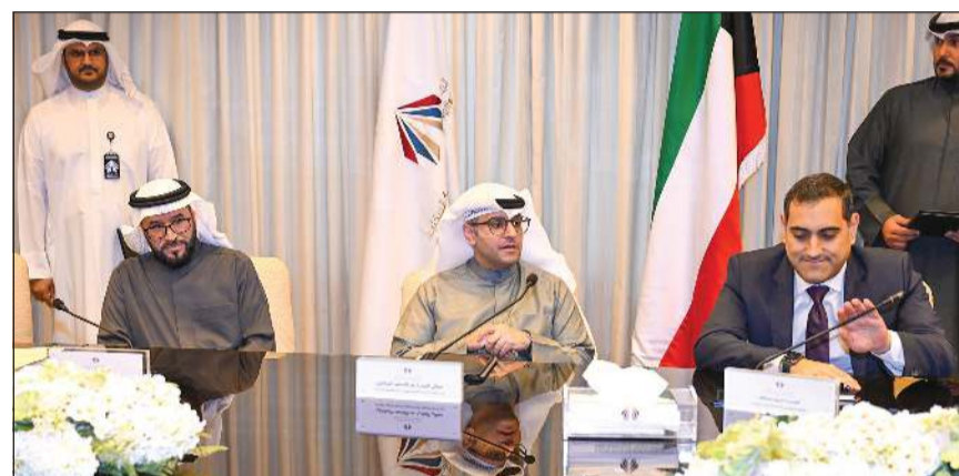
وزير الدولة لشؤون البلدية ووزير الدولة لشؤون الإسكان م.عبدالله المشاري ومدير عام مؤسسة السكنية بالتكليف م.راشد العنزي وممثل شركة «ستراتيجي اند ميدل ايست ليمتد» كريم عبدالله (رئيس كورما)

وقّعت المؤسسة العامة للرعاية السكنية عقد الخدمات الاستشارية الخاص بتطوير ثلاثة مواقع سكنية مختلفة وفقا لأحكام القانون رقم 118 لسنة 2023 بشأن تأسيس شركات إنشاء مدن أو مناطق سكنية وتنميتها اقتصاديا. وقال وزير الدولة لشؤون البلدية ووزير الدولة لشؤون الإسكان عبداللطيف المشاري على هامش توقيع العقد إن هذه الخطوة تعد بداية لخطوات جادة لتفعيل نموذج المطور العقاري والانطلاق الحقيقية للتحويل في فلسفة الرعاية السكنية في الدولة وإشراك القطاع الخاص في دفع عجلة المشاريع الإسكانية وتقديم حلول مستدامة وبدائل متنوعة للمواطنين تتوافق مع الاحتياجات المختلفة للأسر الكويتية ونماذج إسكانية ذات