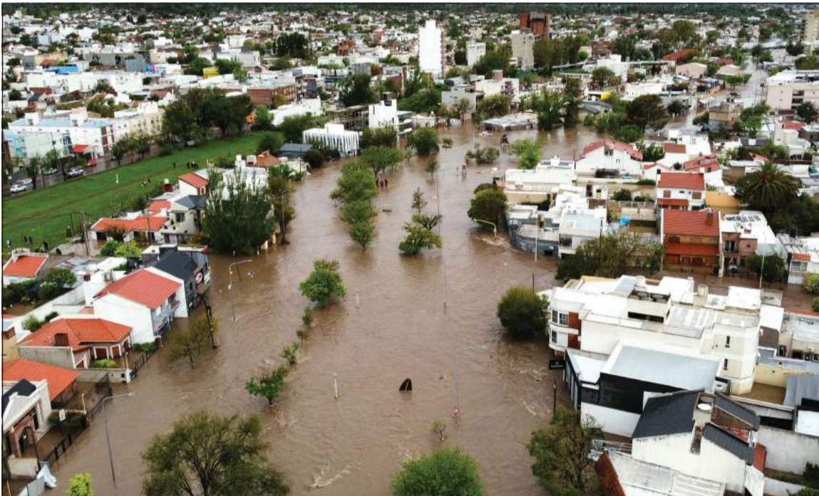
مدينة «باهيا بلانكا» الساحلية في الأرجنتين وقد غمرتها مياه الأمطار الغزيرة

أجزاء مختلفة من المدينة. وأشار إلى أنه تم قطع الكهرباء عن المدينة «لأسباب أمنية». وأظهرت لقطات تلفزيونية مرضات وطاقما طيبا يجولون، بمساعدة الجيش، الأطفال الرضع من وحدة حديثي الولادة في مستشفى خوسيه بينا، أكبر مستشفيات المدينة، والذي كان يجري إخلاؤه. وقد الفت بلدية باهيا بلانكا جميع الأنشطة في المدينة ودعت السكان إلى البقاء