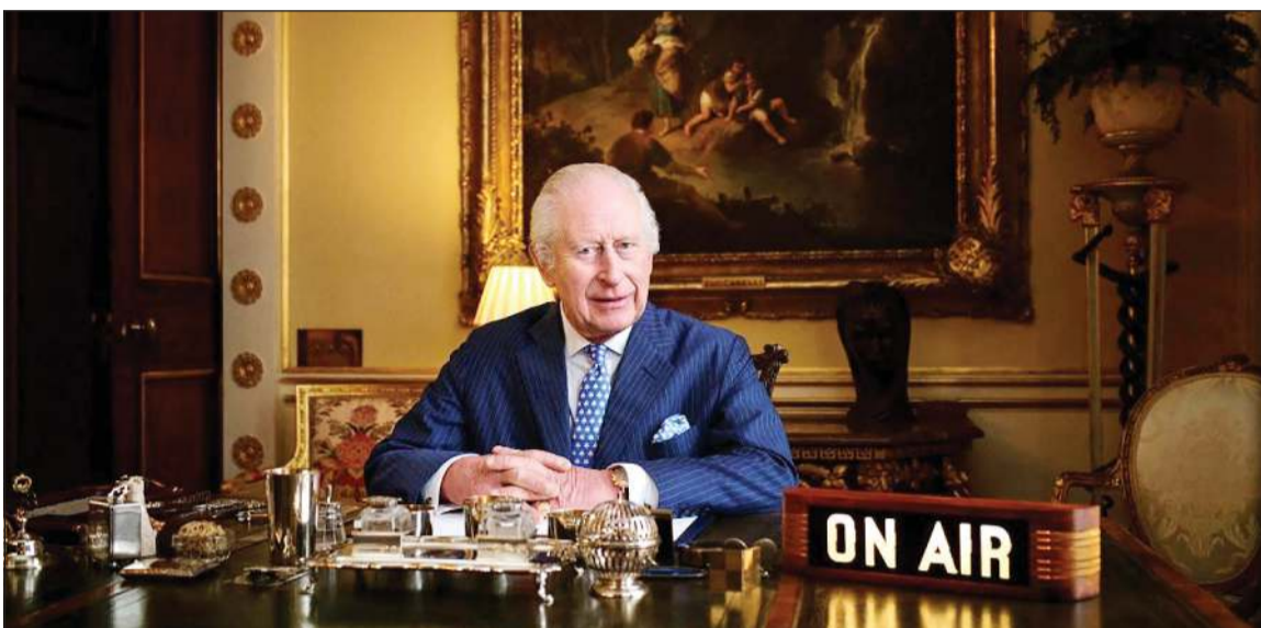
الملك تشالز الثالث في مكتبته حيث يتم تسجيل «غرفة موسيقى الملك» بقصر باكنغهام «انديندنت عربية»

عن بعض الأعمال الموسيقية التي أفرحت، بما في ذلك أعمال أسطورية الريغي الجامايكي بوب مارلي، ونجمة البوب الأسترالية كابلبي مينوغ. وتأتي هذه الأعمال ضمن قائمة من 17 أغنية اختارها الملك تشالز وتحمل عنوان «غرفة موسيقى الملك»، وستداع