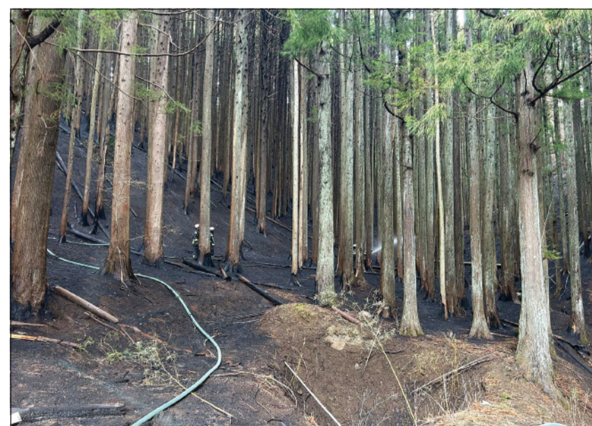
جانب من عمليات إخماد الحرائق في أوفوناتو باليابان

المتضررة تلك التي احترقت في جزيرة هوكايدو عام 1975 والبالغة 2700 هكتار. وعزز الطقس الرطب الذي بدأ الأرباء بعد فترة جفاف قياسية جهود مكافحة الحرائق.