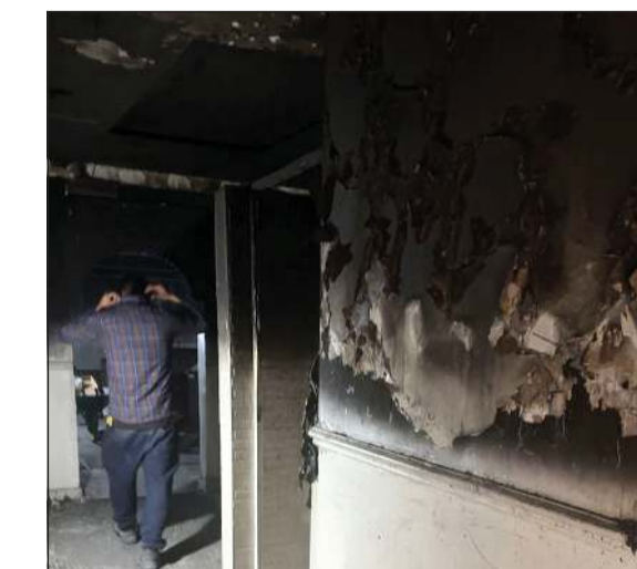
حريق تيما خلف أضرارا مادية