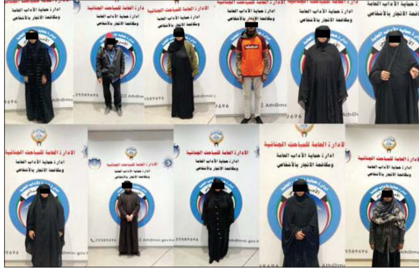
المتسولون الذين تم ضبطهم منذ مطلع شهر رمضان حتى أمس

تأكيداً لما نشرته «الأنباء» في عددها أمس، أعلنت وزارة الداخلية عن ضبط 11 وافداً وواحدة للتسول. وقالت الوزارة في بيان صادر عنها إنه «بناءً على تعليمات رئيس مجلس الوزراء بالإجابة ووزير الداخلية الشيخ فهد اليوسف بمكافحة جميع الظواهر السلبية، وضمن الجهود الأمنية المستمرة للقضاء على ظاهرة التسول التي تتزايد خلال شهر رمضان، تمكن قطاع الأمن الجنائي ممثلاً بإدارة العامة للمباحث الجنائية - إدارة حماية الآداب العامة ومكافحة الاتجار بالأشخاص، من ضبط 11 متسولاً من جنسيات عربية وآسيوية، بينهم 8 نساء و3 رجال أثناء قيامهم بالتسول أمام المساجد والأسواق».