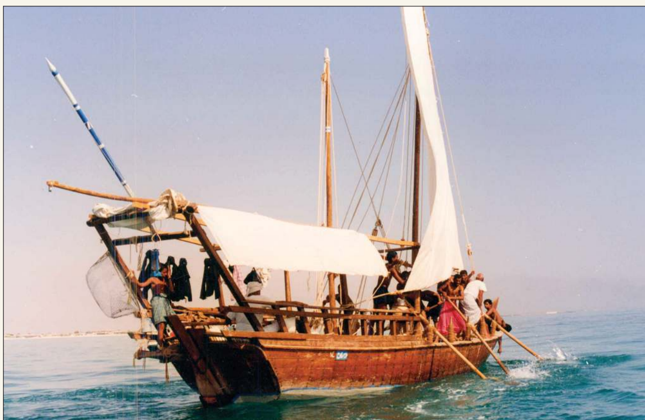
إحدى السفن الشراعية القديمة المبحرة إلى الهند

ويقصد بالطرائف الأدبية ومفردها (طريقة) حادثة غير متوقعة، أو إيراد أبيات من الشعر فيها