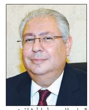
السفير المصري أسامة شلتوت

حريصون على التواجد وطبيعة المشاركين دائماً في تلك المناسبات. ورداً على سؤال عن القمة العربية الطارئة التي استضافتها مصر قبل يومين وأهم ما تضمنته من قرارات، قال السفير شلتوت إن مصر منذ أحداث 7 أكتوبر 2023 دعت إلى مؤتمر قمة للشعوب ولم تقطع الجهود المصرية بعد ذلك والتي تأتي بالتضافر مع جهود الدول المتضامرة أيضاً جهود منظمة التعاون الإسلامي في نصرته القضية الفلسطينية فهي قضية العرب الأولى وهي القضية المحورية التي يدافع عنها كل عربي. وتابع قائلاً: «بالتالي، فإن مصر لم تتأخر يوماً في الدفاع عن القضية الفلسطينية ولهذا جاءت القمة لتؤكد على الحقوق السياسية للشعب الفلسطيني في إقامة دولته وعاصمتها القدس على حدود الرابع من يونيو 1967».