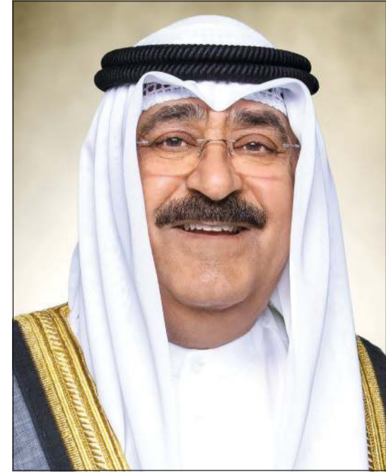
صاحب السمو الأمير الشيخ مشعل بن عبد الله

بعث صاحب السمو الأمير الشيخ مشعل الأحمد برفقة تهنية إلى الرئيس جون دراماني ماهاما رئيس جمهورية غانا الصديقة عبر فيها سموه عن خالص تهنئته بمناسبة ذكرى الاستقلال لبلاده، متمنيا سموه له موفق الصحة والعافية، ولجمهورية غانا وشعبها الصديق كل التقدم والازدهار.