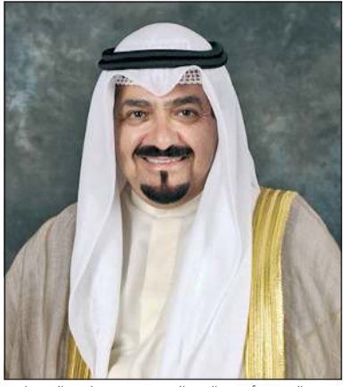
سمو الشيخ أحمد عبدالله رئيس مجلس الوزراء

بعث سمو الشيخ أحمد عبدالله رئيس مجلس الوزراء برفقة تهنية إلى الرئيس جون دراماني ماهاما رئيس جمهورية غانا الصديقة بمناسبة ذكرى الاستقلال لبلاده.