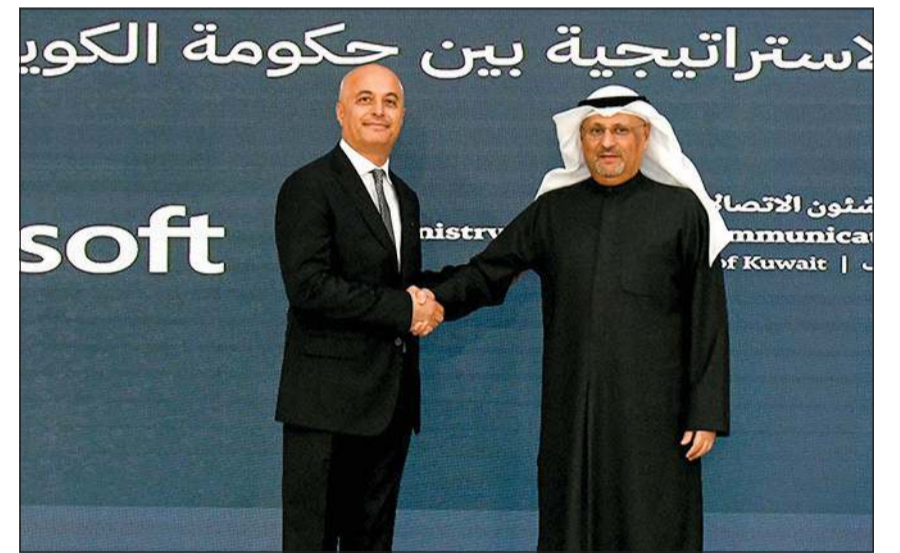
وزير الدولة لشؤون الاتصالات عمر العمر ورئيس «مايكروسوفت» في منطقة أوروبا والشرق الأوسط وأفريقيا سامر أبولطيف