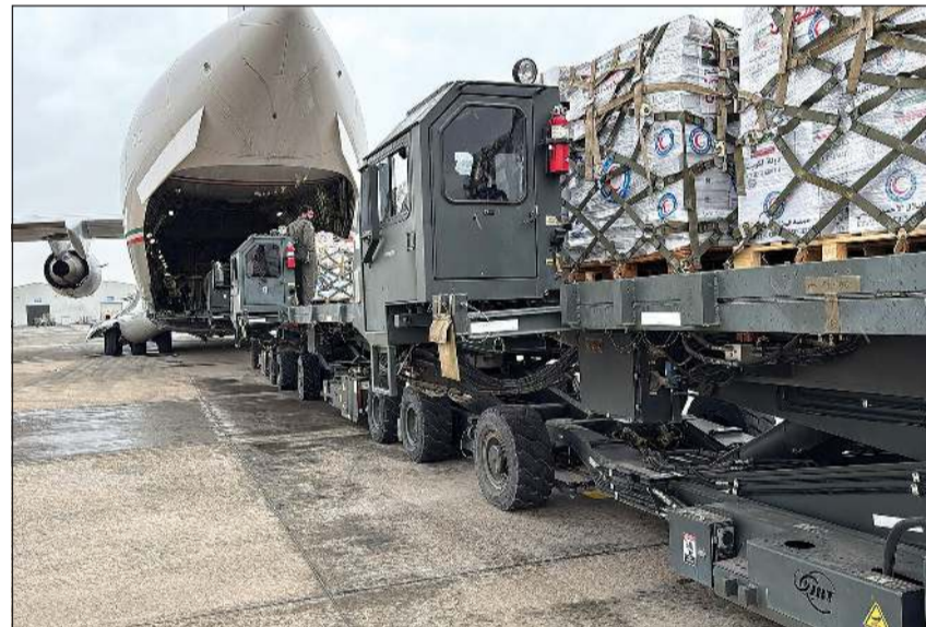
نقل المواد الغذائية والخيام إلى داخل الطائرة الإغاثية

على إسهاماتهم في إنجاح هذه المهمة الإنسانية. وبين أن الإغاثة المجتمعية ساهمت في توفير الأدوية والمستلزمات الطبية وسيارات الإسعاف والغذاء والخيام للمنازحين السودانيين وبالتنسيق مع الهلال الأحمر السوداني للعمل على توزيعها. وقال المغامس إن هذه المساعدات الإنسانية تأتي في إطار العائلات التي تجمع البلدين والشعبين