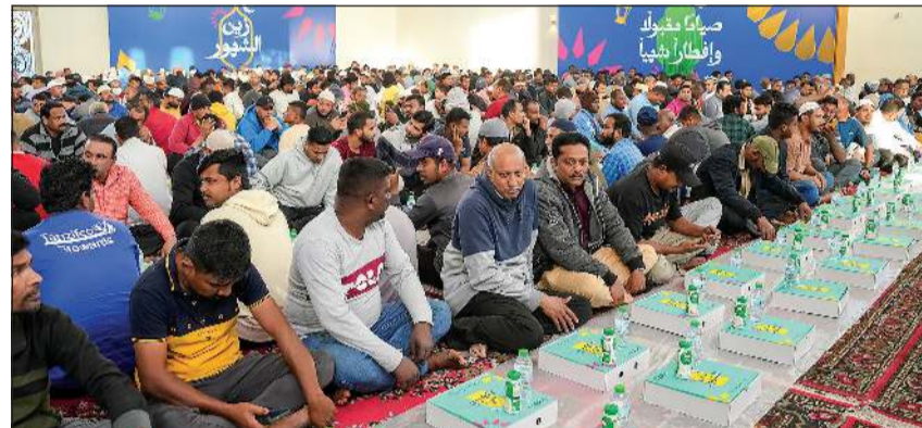
المبادرة مستمرة يومياً طوال الشهر الكريم

للأسر المتعففة والمحتاجين داخل مختلف مناطق الكويت. دائماً ما تأتي حملة «زين الشهور» بشكل متجدد وتتوسع في برامجها ومبادراتها مع مرور كل عام، وتقوم الشركة من خلالها بتجسيد روح العطاء التي يتميز بها الشهر الفضيل عن غيره من الشهور، وتعكس القيم الأصيلة التي جبل عليها أهل الكويت في مساعدة الغير ونشر قيم الحب والسلام.