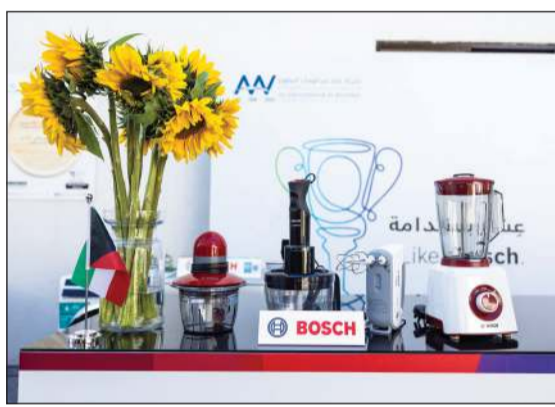
معدات «بوش» خلال الفعالية

وتقليل البصمة الكربونية وتعزيز ممارسات الطهي المستدام، مما يجعلها الخيار المثالي للمستهلكين المهتمين بالبيئة. يذكر أن فعالية «من الكوكب إلى الطبق» Planet to Plate هي حدث نظمته شركة المعيشة المستدامة في الكويت، تزامناً مع اقتراب شهر رمضان، بالتعاون مع جريدة كويت تايمز وقد جمع الحدث بين التوعية والتربية لمعالجة الزيادة الموسمية من هدر الطعام، كما استضاف مزارعين محليين وطهاة وخبراء في الاستدامة لاستكشاف رحلة الغذاء من المزرعة إلى المائدة، وذلك وسط أجواء تفاعلية مليئة بالموسيقى والفنون. وعروض الطهي المبتكرة.