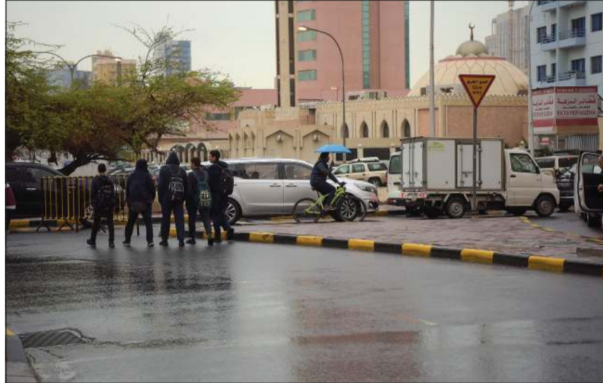
أجواء ممطرة (محمد هاشم)

كونا: توقعت إدارة الأرصاد الجوية هطول أمطار متفرقة تكون رعدية أحياناً على بعض المناطق حتى صباح يوم السبت المقبل. وقال مدير الإدارة بالندب ضرار العلي لـ «كونا» إن البلاد ستتأثر بامتداد مرتفع جوي ضعيف يسمح بتقدم منخفض سطحي رطب يتزامن مع منخفض جوي في طبقات الجو العليا يؤدي إلى تكاثف السحب المنخفضة والمتوسطة وبعض السحب الركامية مصحوبة بهطول أمطار متفرقة تكون رعدية أحياناً على بعض المناطق. وأوضح العلي أن الأمطار ستكون مصحوبة بنشاط في الرياح الجنوبية الشرقية تصل سرعتها إلى أكثر من 50 كيلومتراً في الساعة تؤدي إلى انخفاض الرؤية الأفقية على بعض المناطق وخاصة