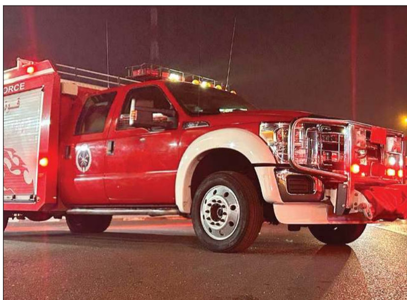
ألية من مركز إطفاء الجھراء الحرفي في موقع الحادث

العيون، مشيرة إلى أن الحادث أسفر عن إصابة شخصين وحالة وفاة، هذا، وانتقل رجال الأمن والأدلة الجنائية لرفع الجثة ومعاينة الجهة وتسجيل قضية تصادم ووفاة.