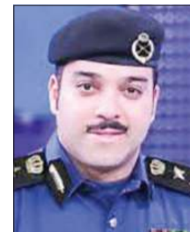
العميد محمد الغريب

المبكر في حال حدوث حريق، وكذلك عدم إبقاء الفحم بعد استخدامه في أماكن مغلقة والتأكد من تهوية المكان. وناشد الجميع في حال حدوث أي طارئ عدم التردد والاتصال على رقم الطوارئ كما دعا العميد الغريب