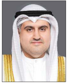
وزير العدل المستشار ناصر السميطة