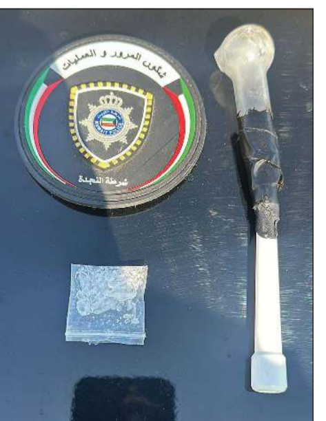
المضبوطات والمتهمون تمت إحالتهم إلى الإدارة العامة لمكافحة المخدرات

على صعيد آخر، أحيل خليجي النجدة مواطناً من مواليد 1992 إلى الإدارة العامة لمكافحة المخدرات، وذلك على خلفية العثور بحوزته لدى توقيفه للاشتباه به في الإحتمال على سيجارة ملغمة بمادة مخدرة وقطعة خشيش وكذلك أداة للمعاطي إلى جانب ورق لف.