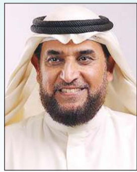
بقلم: د. عمر الشايحي