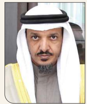
بقلم: د. عبدالله الشريكة

كان رسول الله ﷺ يستقبل شهر رمضان بالبشر والترحاب، وكان المسلمون يفرحون لمقدم الشهر الكريم ويتنافسون في الطاعات وفي سائر العبادات. ولحرصه ﷺ على اغتنام هذا الشهر المبارك ولحبه لامته كان ينههم إلى أهميته ويدعوهم إلى المحافظة على صيام نهاره وقيام ليله وإلى المواصلات والتكافل فيما بينهم، وينبههم إلى ما ينبغي عليهم أن يحرصوا عليه.