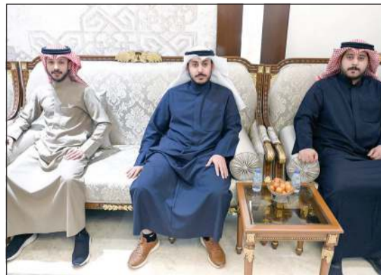
مباركون بالشهر الفضيل