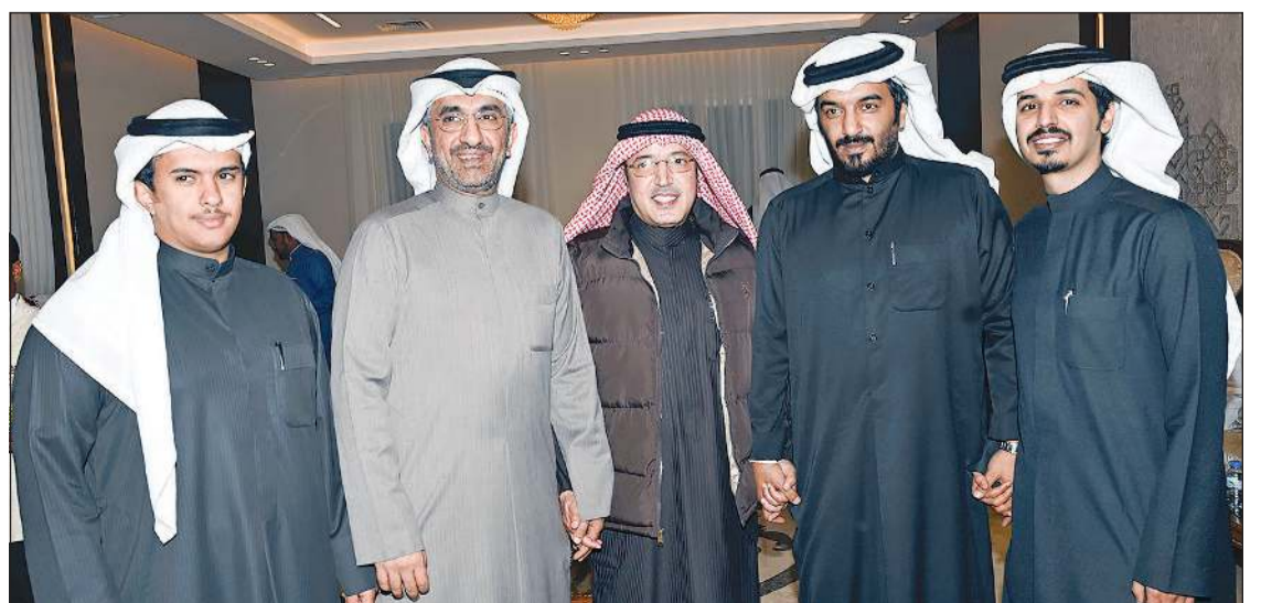
الخينين مع عدد من المهنيين في ديوانه