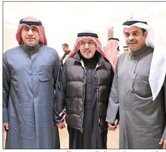
فهد الخنين متوسما متعب الجلال وسعود الكندري

اعتراض وزير الدولة لشؤون البلدية ووزير الدولة لشؤون الإسكان عبداللطيف المشاري على قرار بشأن نقل محول. وقال المشاري في كتابه المرسل إلى رئيس المجلس البلدي: نحيطكم علما أننا اطلعنا على محضر اجتماع المجلس البلدي الحضاري عشر العادي لدور الانعقاد الثالث للفصل التشريعي الثالث عشر المنعقد بتاريخ