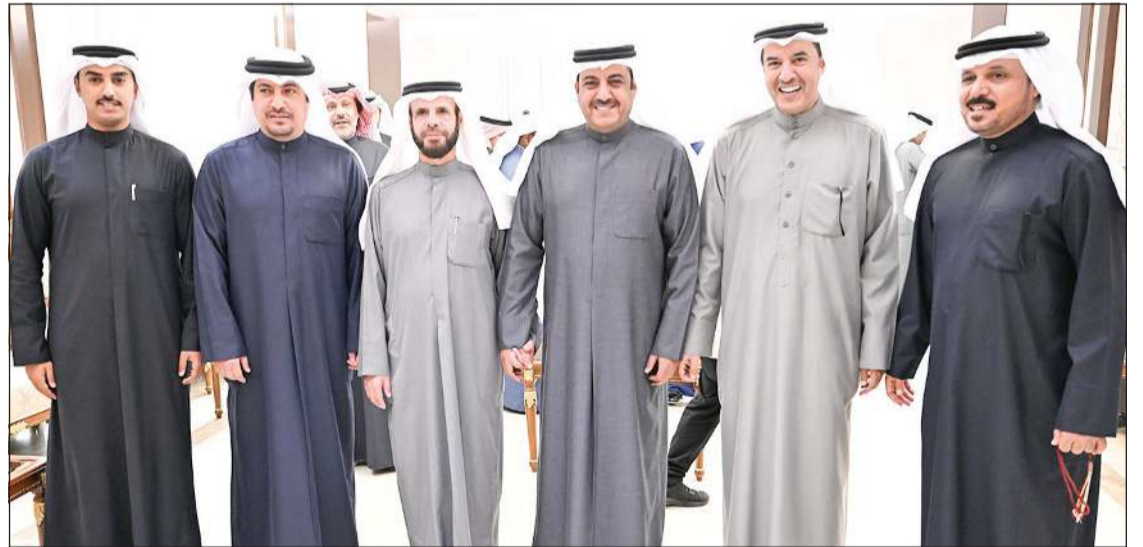
جانب من المباركين بشهر رمضان في ديوان الخنين بمنطقة الرقة