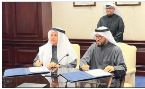
الوزير عبداللطيف المشاري يشهد توقيع العقود

النسبة التعاقدية الشهرية. وذكرت أنها باشرت فعليا في تنفيذ العقود التي جرى توقيعها في وقت سابق، حيث جرى فعليا تحقيق تقدما في انجاز البنية التحتية للطرق الرئيسية بنسبة 26% متقدما عن البرنامج بنسبه 17% والتي تشمل شبكة صرف مياه الأمطار والحفر النفقي للصرف الصحي، إلى جانب البدء في أعمال إنارة الطرق والحوائط الساندة وشبكة الصرف الصحي وخزانات مياه الأمطار والمياه المعالجة في بعض الضواحي بناء على الجدول المعد لذلك. ولفتت إلى أن التنفيذ الفعلي شمل كذلك أعمال الجسور والأنفاق وشبكتي المياه العذبة وقليلة الملوحة.