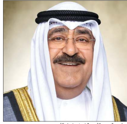
صاحب السمو الأمير الشيخ مشعل الأحمد

كونا: بعث صاحب السمو الأمير الشيخ مشعل الأحمد ببرقية تهنئة إلى الرئيس رومين راديف رئيس جمهورية بلغاريا الصديقة عبر فيها سموه عن خالص تهانئه بمناسبة ذكرى العيد الوطني لبلاده، متمنيا سموه له موفور الصحة والعافية وللجمهورية وبلغاريا وشعبها الصديق كل التقدم والازدهار.