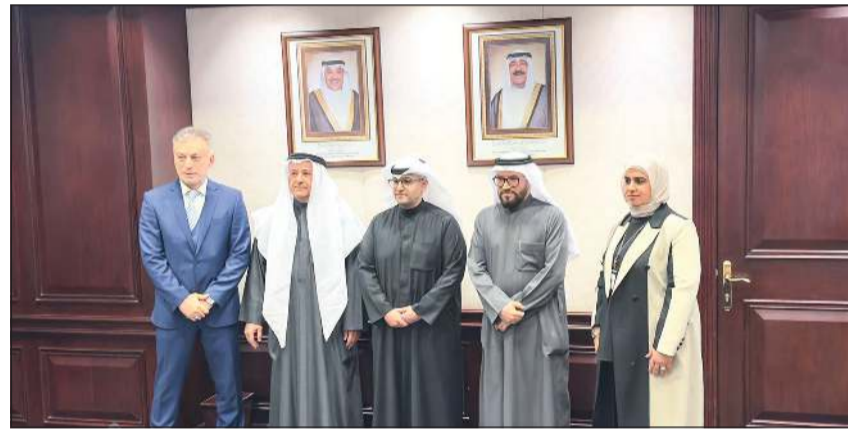
وزير الدولة للشؤون البلدية ووزير الدولة لشؤون الإسكان عبداللطيف المشاري ومدير عام المؤسسة بالتكليف م. راشد العنزي مع الحضور خلال توقيع العقود

الخدمات تغطي 23551 قسيمة سكنية ونسب الإنجاز في المشروع تحقق تقدماً عن الإنجاز التعاقدى