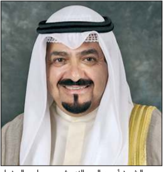
سمو الشيخ أحمد عبدالله رئيس مجلس الوزراء

كونا: بعث سمو الشيخ أحمد عبدالله رئيس مجلس الوزراء ببرقية تهنئة إلى الرئيس رومين راديف رئيس جمهورية بلغاريا الصديقة بمناسبة ذكرى العيد الوطني لبلاده.