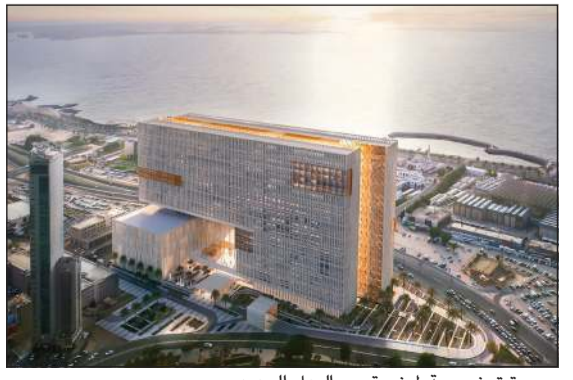
صورة توضيحية لمبنى قصر العدل الجديد

أصدر وزير العدل المستشار ناصر السميح قراراً بنقل كل دوائر المحكمة الكلية ومحكمة الاستئناف ومحكمة التمييز من مقرها الحالي بمبنى قصر العدل الجديد اعتباراً من الأحد المقبل 9 مارس. وجاء في القرار كذلك نقل كل دوائر محكمة الأسرة «العاصمة - الكلية - الاستئناف» إلى مبنى قصر العدل الجديد. ومع بدء الانتقال التدريجي لدوائر المحاكم إلى مبنى قصر العدل الجديد، كشف مصدر مسؤول عن أن نظام عقد الجلسات عن بعد في طور الدراسة تمهيداً للتنفيذ. وبين المصدر أن وزارة العدل تعمل على توفير أفضل المواصفات الفنية واعتماد اللائحة التنفيذية من أجل «عدل بلا ورق».