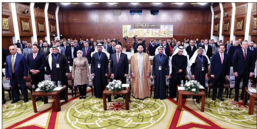
الحضور وقومًا خلال بداية انطلاق أعمال المؤتمر العام الأول للاتحاد الخليجي للإعلام

انطلقت في العاصمة العراقية بغداد المؤتمر العام الأول للاتحاد الخليجي للإعلام تحت شعار «خليجنا واحد»، وذلك برعاية رئيس الوزراء العراقي محمد شياع السوداني، والذي أثنى عليه وزير الثقافة والسياحة والآثار أحمد فكاك البدراني، وبحضور فنانون خليجيين وعراقيين وإعلاميين من مختلف الصحف ووسائل الإعلام.