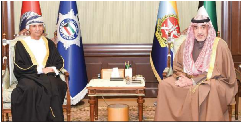
رئيس مجلس الوزراء بالإجابة وزير الداخلية الشيخ فهد اليوسف مستقبلاً الممثل الخاص للأمم المتحدة في العراق ورئيس بعثة الأمم المتحدة لمساعدة العراق السفير د.محمد الحسان

لجهود وزارة الداخلية في دعم الأمن الإقليمي، مؤكداً أهمية استمرار التنسيق مع الجانبين من جانبه، أعرب د.الحسان عن تقديره