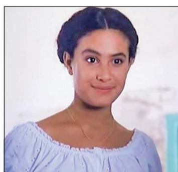
هند صبري في الفيلم