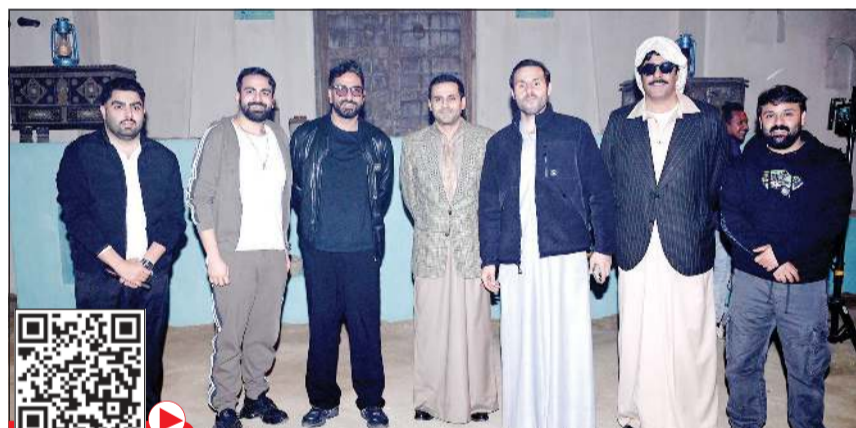
فريق عمل الأغنية

وتقول بعض كلمات الأغنية: تحيا الكويت.. للجز والأجداد سباقه.. تحيا الكويت.. وصيتنا في الكون وأقائه يا كويت دمي وداري وبلادي.. يا كويت أحبب حب مو عادي.. هيا هيا هيا.. يا بلد حرة أبية.. انتي من الله هدية.. دمتي حية دمتي حية مثل بلادي ما تلقون.. عشقي وروحي ونظر العيون تحيا الكويت.. وصيتها في الكون وأقائه.. الغالية