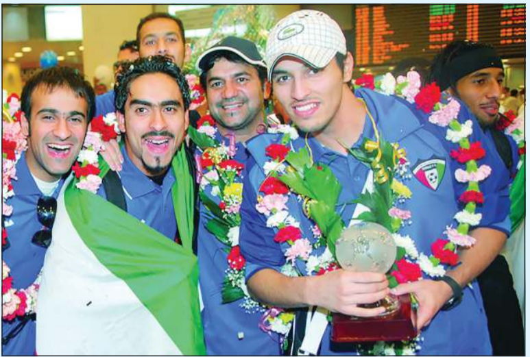
لاعب المنتخب الوطني يحتفلون بلقب بطولة غرب آسيا السادسة