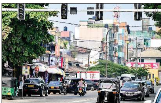
انقطاع الكهرباء بسبب القرد شمل حتى إشارات المرور

كولومبو - أ.ف.ب: دخل قرد محطة فرعية لتوليد الكهرباء في سريلانكا، متسببا في انقطاع التغذية بالتيار الكهربائي في أنحاء مختلفة من الجزيرة أمس، على ما قال مسؤولون حكوميون. واستمر انقطاع التغذية بالكامل لأكثر من ثلاث ساعات. وقال وزير الطاقة كومارا جياكودي للصحافيين «دخل قرد إلى محول على شبكتنا مما تسبب في خلل بالنظام»، مشيراً إلى أن الحادثة حصلت في ضاحية بجنوب العاصمة كولومبو. وفي وقت لاحق استعادت التغذية بالتيار الكهربائي تدريجياً. وقال الوزير إن المهندسين عملوا «على محاولة استعادة الخدمة في أسرع وقت ممكن».