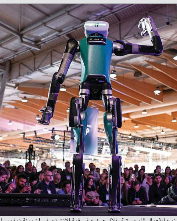
الروبوت «ديجيت» متعدد المهام والمصنوع للأعمال اللوجستية خلال عرضه في قمة الإنترنت في لشبونة نوفمبر الماضي

ووصل حجم سوق الذكاء الاصطناعي في التعليم العالمي إلى 4 مليارات دولار عام 2022، وفق دراسة أجرتها شركة «غلوبال ماركتس إنسايتس» Global Markets Insights.