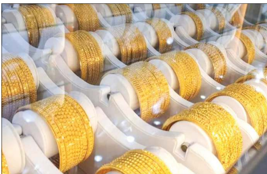
أحد محال الذهب في «غرين ستريت» شرق لندن

لندن - أ.ف.ب: يواجه هاتون غاردن، حي المجوهرات الشهير في لندن، إقبالا كبيرا من الزبائن والباعة على السواء بحثا عن صفقات مربحة، في ظل تسجيل أسعار الذهب أرقاما قياسية متتالية.