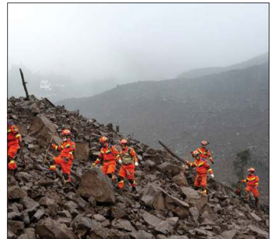
رجال الإنقاذ خلال عملية البحث عن المفقودين في موقع انهيار أرضي بمقاطعة سيتشوان

تشنغدو - شينخوا: تسببت انهيار أرضي في مقاطعة سيتشوان جنوب غربي الصين، في وفاة شخص وفقدان 28 آخرين، فضلا عن إصابة اثنين آخرين، حسبما أفادت السلطات المحلية.