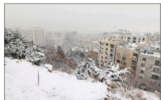
الثلوج تغطي العاصمة طهران امس

طهران - أ.ف.ب: أمرت السلطات في إيران بإغلاق المدارس والمكاتب في 10 محافظات على الأقل أمس، بهدف توفير الطاقة، حيث تواجه البلاد موجة برد شديد، حسبما ذكرت وسائل إعلام رسمية.