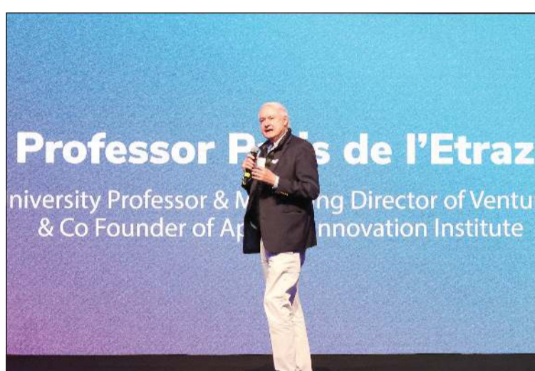
البروفيسور باريس دي إيتراز ملقياً كلمته