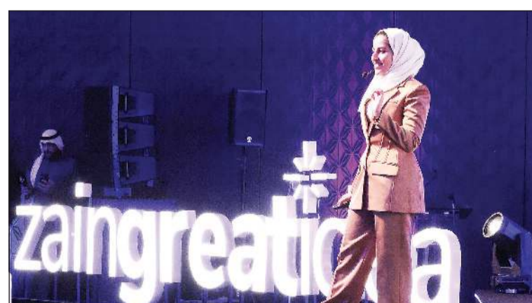
إحدى رائدات الأعمال خلال الحفل

ساهم في تغيير القواعد منذ البداية، وقام ببناء منظومات العمل، ووضع الأسس والمعايير، ولن أخفي عليكم أننا أخذنا من الاستثمارات حتى اليوم».