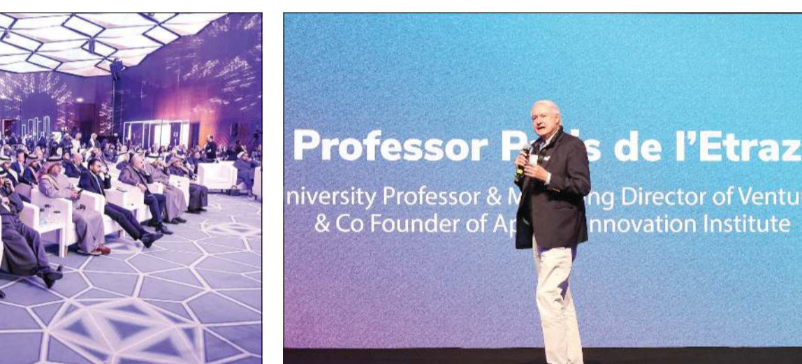
البروفيسور باريس دي إيتراز ملقياً كلمته

وحرص الغريبي على شكر كل من ساهم في نجاح البرنامج: «أود أن أنتهز هذه الفرصة لأشكر جميع من ساهم في إنجاح نسختنا الأخيرة، وفي مقدمتهم شركة Zain Ventures التي نعتبرها أحد محركات الدفع الرئيسية لاستراتيجية مجموعة زين، وتمثل المحطة الاستثمارية لمشاريع المجموعة، وهي تستمر بالسعي في رسالتها لفتح آفاق الفرص الاستثمارية في رأس المال المغامر، والتكنولوجيا المالية والابتكارات الرقمية».