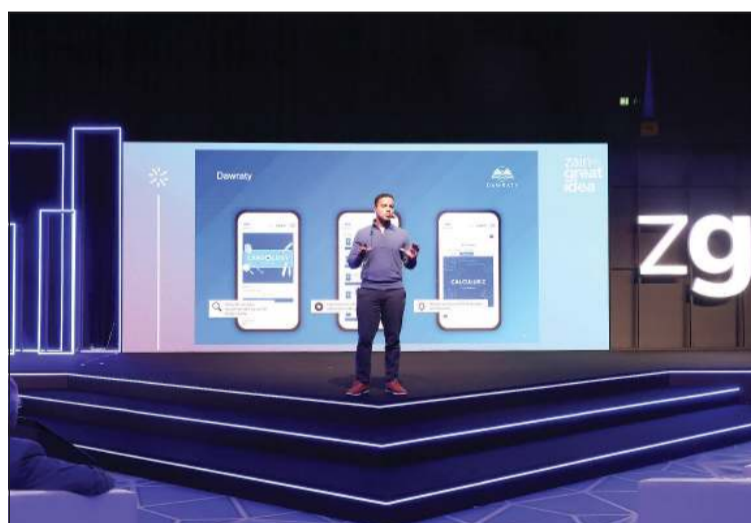
أحد المشاركين يشارك الحضور الرؤية الإستراتيجية لشركته