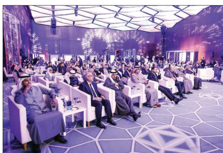
جانب من الحضور خلال الحفل

وفي برنامج التسريع العالمي الذي عادة ما يكون على المستوى الدولي في وجهات رائدة مثل وادي السيليكون في الولايات المتحدة وغيرها من الوجهات، ستسهم هذه الخطوة بإضافة تجارب جديدة وفرص أكبر لجميع المشاركين، كونهم لا يمثلون السوق الكويتي فحسب، بل ينتمون إلى مختلف الأسواق في المنطقة، ما سيعكس قوة ومتانة منظومة ريادة الأعمال العربية ويعززها على المستوى الدولي.