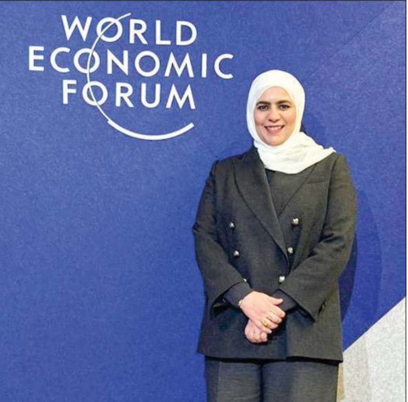
وزيرة المالية ووزيرة الدولة للشؤون الاقتصادية والاستثمار نورة الفصام خلال مشاركتها في منتدى دافوس

تتذبذب بعد هذه التصريحات في الأسواق، لكن نعتقد أن ظهور الأثر عقب تنفيذ هذه الخطط يأخذ فترة من الزمن، فضلاً عن أن ظهور الأثر الاقتصادي على الدول المصدرة والمنتجة للنفط يمكن أن يكون له أثر طويل الأمد وليس قصير الأمد، وبالفعل تذبذب الأسعار مع خفض مستويات الإنتاج المطبقة على حصص دول «أوبك» ساهم في تباطؤ الاقتصاد خصوصاً الاقتصاد المحلي». وقالت إن التباطؤ الاقتصادي المحلي كان يسبب تغير حصة الإنتاج وفقاً لاتفاق «أوبك+» وانخفاض أسعار النفط، ولكن هناك بارقة أمل ونحن متفائلون بالمستقبل القريب خصوصاً أننا نمضي في زيادة الإنفاق الرأسمالي، وهناك أيضاً عوامل أخرى في الاقتصاد وهو التضخم ومحاولات التحكم فيه، بالإضافة إلى انخفاض معدلات الاستثمار والتنازلي الذي سيدفع بزيادة معدلات المشاريع والاقتراض من قبل كبار الشركات في الدولة، والتي يمكنها جذب المزيد من الاستثمارات داخل الكويت، الأمر الذي سيسهم في تنشيط عجلة التنمية، والذي نتوقع أن يكون في البداية بحدود 2.6% خلال العام الحالي، وهذا يتماشى مع توقعات البنك الدولي، مشيرة إلى أنه للوصول إلى التعافي المطلوب سيكون بالتزامن مع تنفيذ تلك الخطط ودفع الاستثمارات والتنوع الاقتصادي، وبالتالي سوف تدخل الكويت مرحلة جديدة من تنويع الدخل مع وجود إصلاحات مالية واقتصادية جادة ونسعى لأن يكون هناك اقتصاد مرّن ومستدام خلال المرحلة المقبلة.