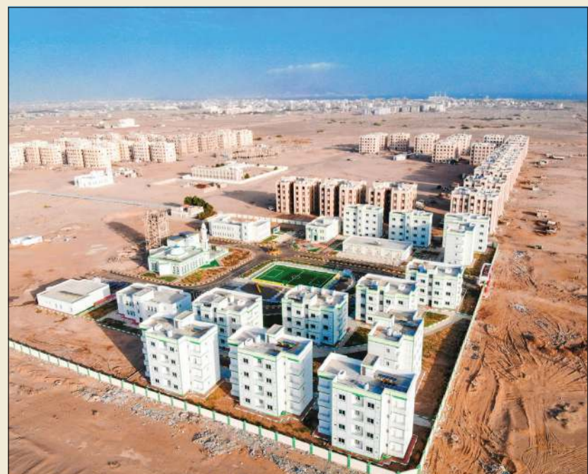
مشروع مدينة السلام الكويتية في عدن