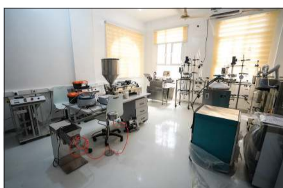
مشروع تجهيز وتأثيث معامل ومختبرات كلية الصيدلة

المياه، والصحة، والنقل، والطاقة، والزراعة والثروة السمكية، والبرامج التنموية، وتنمية ودعم قدرات الحكومة. ويسهم البرنامج في تحقيق الاستقرار في اليمن، وإرساء ركائز الأمن والسلام، من خلال مشاريع ومبادرات تنموية نفذها البرنامج، لتحسين البنى التحتية في المجالات التي يحتاج إليها المواطن اليمني، عبر مكاتبه الموزعة على المحافظات اليمنية، ومتابعة الأعمال والإشراف عليها بشكل مباشر، ودراسة الاحتياجات من الميدان، ورفع التقارير الخاصة بسير وإنجاز العمل، وتوضيح التحديات وتعلم الدروس المستفادة على الأرض، ومعرفة اثر وانعكاسات المشاريع والبرامج والأنشطة، والمبادرات على المستفيدين، لإيجاد الحلول الإنشائية الملائمة والمستدامة.