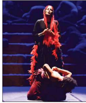
مسرحية «أسطورة شجرة اللبان» - عُمان