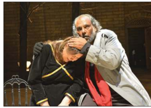
مسرحية «سيرك» - العراق