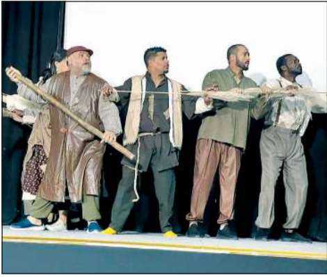
مسرحية «بين قلبين» - قطر