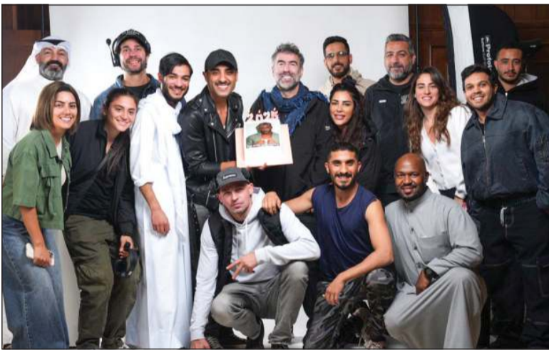
... ومع فريق مسلسل «وحوش»