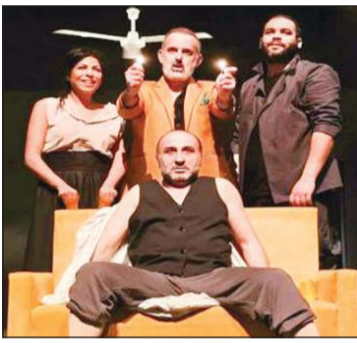
مسرحية «البخارة» - تونس