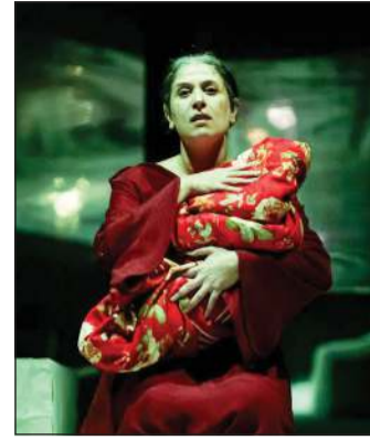
مسرحية «كيف نسامحنا» - الإمارات