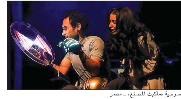
مسرحية «ماكث المصنع» - مصر

عبر لـ «الأنباء» عن سعادته بالمشاركة فيه مع كوكبة من النجوم