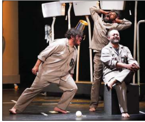
مسرحية «المؤسسة» - البحرين