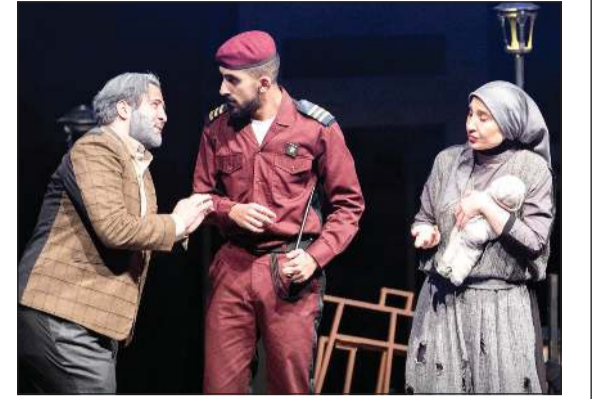
مسرحية «غصة عبور» - الكويت

حفل ختام المهرجان يقام تحت رعاية وزير الثقافة والرياضة والشباب بسلطنة عمان.. و «غصة عبور» تمثل الكويت فيه