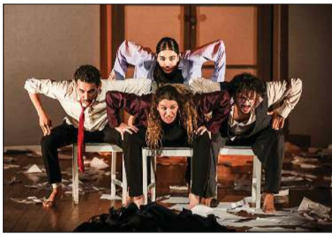
مسرحية «هم» - المغرب