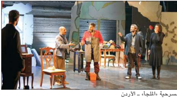
مسرحية «الملجأ» - الأردن

تأليف وإخراج جواد الأسدي، «ريش» لمسرح شادن للرقص المعاصر بفلسطين، من تصميم وإخراج شادن أبو العسل، «هم» لمسرح أنفاس بالمغرب، من تأليف عبدالله زريقة وإخراج أسماء الهوري، «البخارة» لمسرح أوبرا تونس قطب