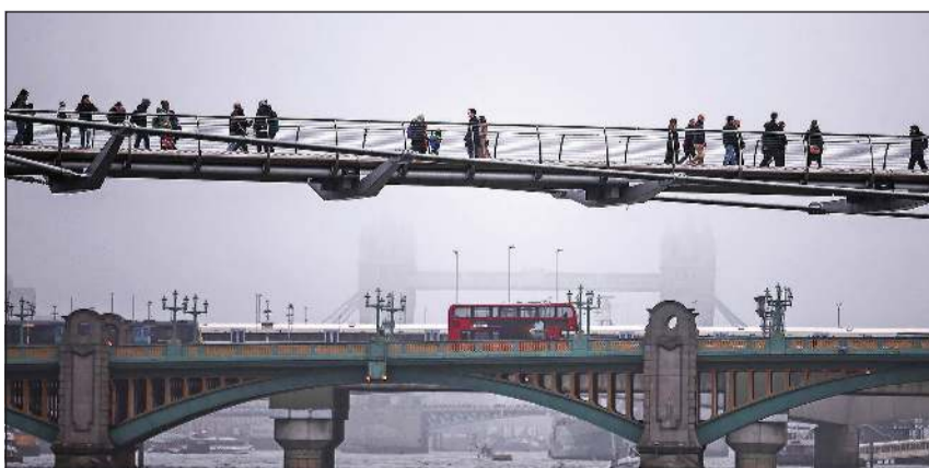
ضباب كثيف غطى العاصمة البريطانية لندن وعطل الملاحة الجوية

عواصم - وكالات: تسبب الضباب الكثيف في عرقلة حركة الملاحة الجوية في عدة مطارات بريطانية كبيرة بحسب ما أعلنت الخدمة الوطنية للملاحة الجوية في البلاد. ويعد مطاراً غاتويك (لندن) ومانشستر، وهما ثاني وثالث أكثر المطارات نشاطاً في بريطانيا، من الأكثر تأثراً بهذا الضباب. وقال ناطق باسم مطار غاتويك في تصريحات لوكالة فرانس برس أمس إنه نظراً إلى «سوء الرؤية»، تم تأخير بعض الرحلات طوال اليوم. وكانت قد ألغيت أمس الأول عشرات الرحلات من مطارات مانشستر وغاتويك وهيرفو (لندن) وتم تأخير مئات الرحلات الأخرى. ودعت الخدمة الوطنية للملاحة الجوية في بريطانيا كل المسافرين إلى التواصل مع شركات الطيران لمعرفة إن كانت رحلاتهم ما زالت قائمة. على صعيد مختلف، ضربت أمواج قوية بلغ ارتفاعها 6 أمتار، الساحل الشمالي لبيروت، ما تسبب في أضرار جسيمة