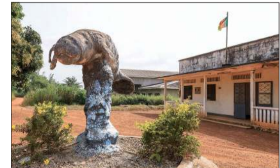
تمثال حيوان المانتيني عند طريق سريع في بلدة ديزانغو

ديزانغو - أ.ف.ب: منذ مشاهداته الأولى في بحيرة أوسا في الكاميرون، يناضل الدكتور في علم الأحياء البحرية أريستيد تاكوكام كاملا، لحماية خراف البحر الأفريقية، وهو نوع نادر معروف ومهدد بالانقراض، يعيش في المياه العذبة للساحل الغربي للقارة.