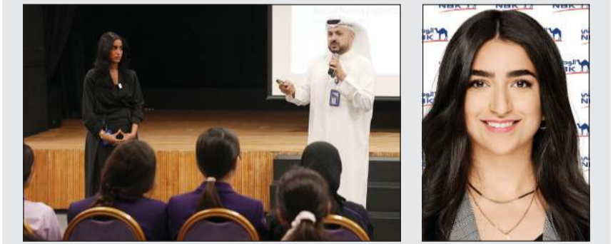
جانب من فعاليات الجلسة التوعوية للبنك الوطني