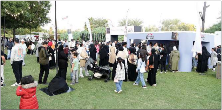
تفاعل كثيف من الحضور مع فعاليات بنك بوبيان