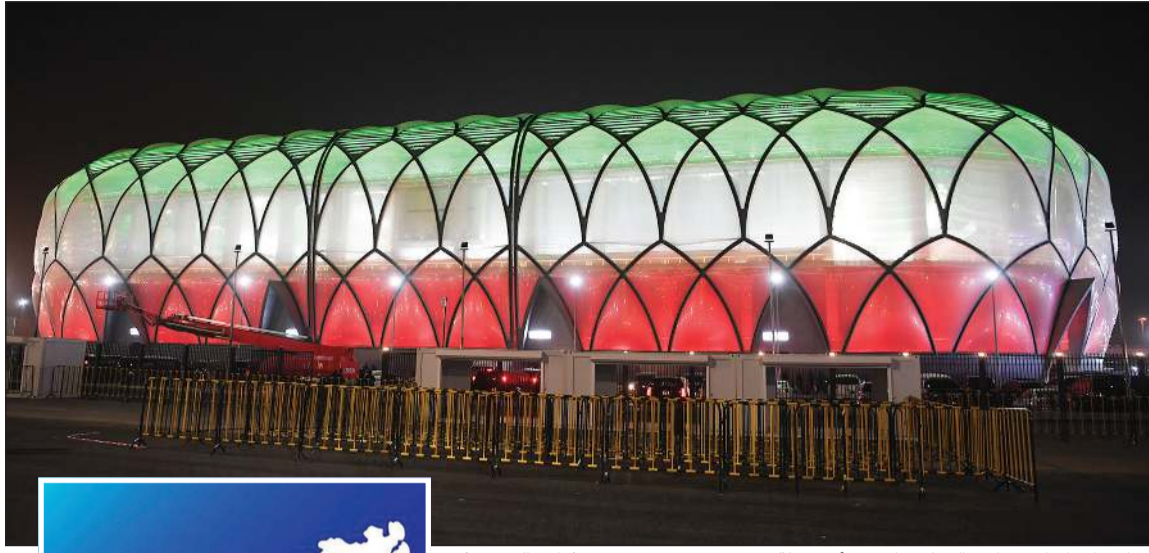
ستاد جابر المبارك بنادي الصليبخات في أبهى حلة (هاني الشمري)