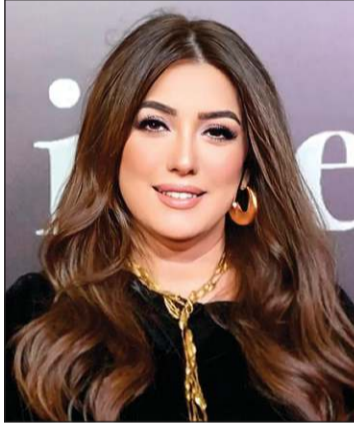
لم تكن تتوقع الإصابة، مشيرة إلى أن زوجها الفنان عمرو يوسف كان مرعوباً، ويبدو أنه كان يشك في

وفي يونيو الماضي، فجات كندة جمهورها بإعلان إصابتها بسرطان الثدي، خلال مشاركتها في بودكاست مع الإعلامية منى الشاذلي عبر قناتها على «اليووتيوب»، ونصرت «الترند» بعد الحديث عن رحلتها المرضية، وتحديثت عن المرض بالتفاصيل. وأضافت أن جدتها وخالتها وخالها جميعهم توفوا بالسرطان، لكنها