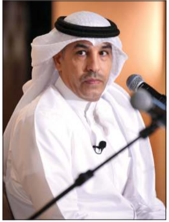
المطرب عبدالعزيز الضويحي

في ظل التنافس التي تعيشه القنوات الفضائية خليجياً وعربياً لاستقطاب نجوم الأغنية إلى شاشاتها، نجح تلفزيون الكويت بقيادة وكيله تركي المطيري في استقطاب نجم الأغنية الشهابية مطرف المطرف لتقديم جلسة غنائية مميزة كل خميس يبث مباشر، يستضيف فيها العديد من المطربين الكبار والشباب، والتي تعتبر خطوة موفقة ومميزة تحسب للقائمين على قطاع التلفزيون. برنامج «جلسة مع المطرف» الذي يبث على شاشة تلفزيون الكويت ومنصة 51 التابعة لوزارة الإعلام يعتبر التجربة الأولى للفنان مطرف المطرف في تقديم مثل هذه النوعية من الجلسات الغنائية، حيث تمكن المطرف باقتدار