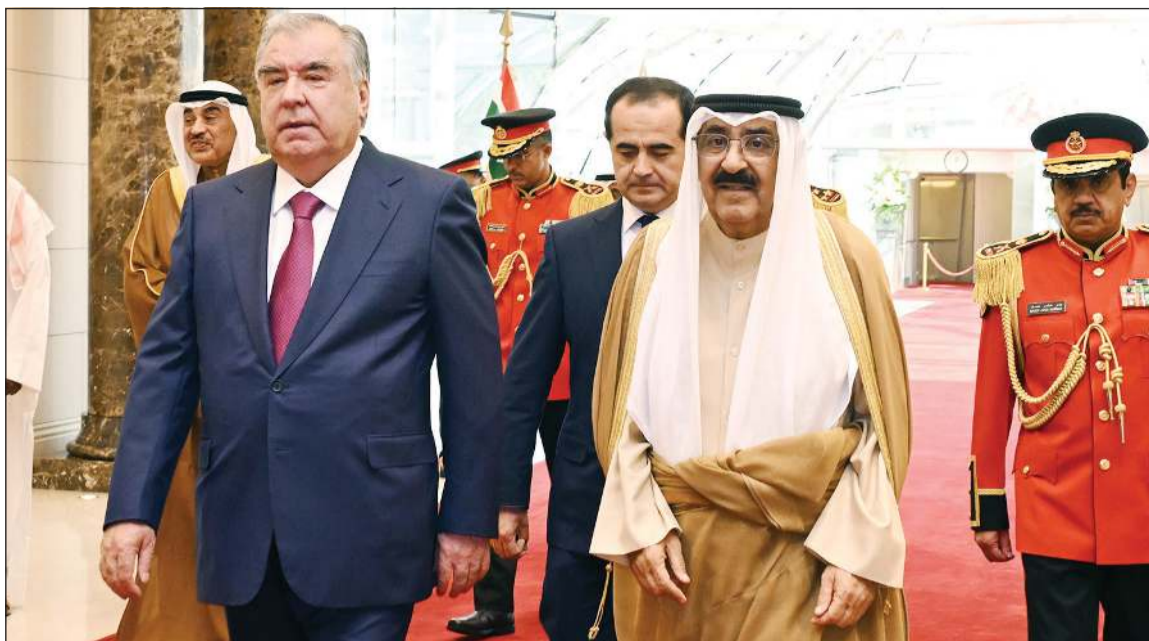
صاحب السمو الأمير الشيخ مشعل الأحمد في استقبال الرئيس إمام علي رحمان رئيس طاجيكستان