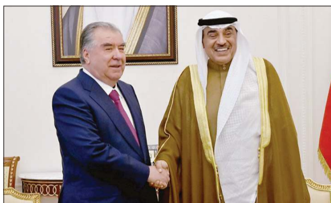
سمو ولي العهد الشيخ صباح الخالد خلال جلسة المباحثات مع رئيس طاجيكستان إمام علي رحمان