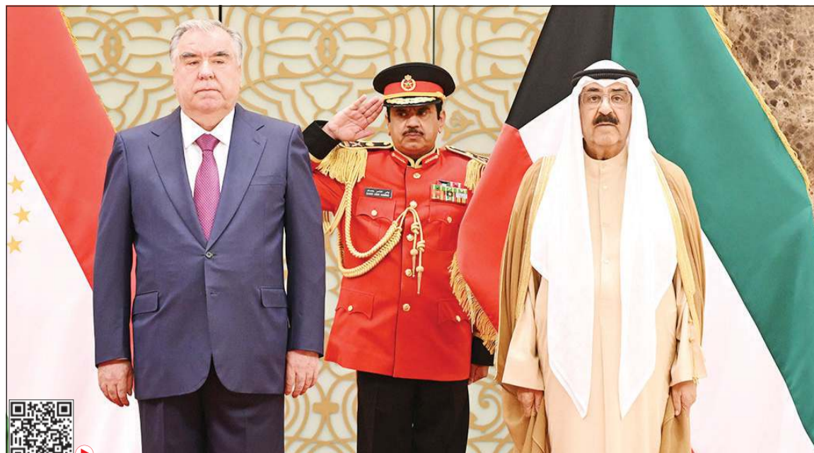
صاحب السمو الأمير الشيخ مشعل الأحمد خلال استقبال الرئيس إمام علي رحمان رئيس طاجيكستان