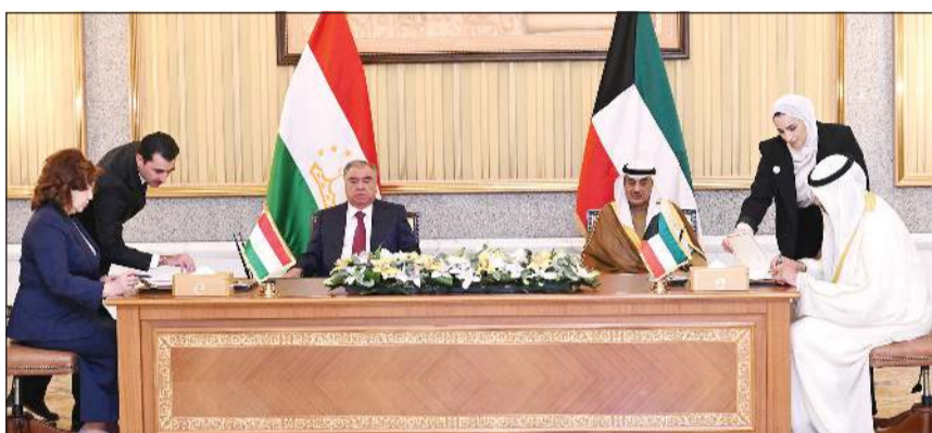
توقيع إحدى منكرات التفاهم بين الكويت وطاجيكستان بحضور سمو ولي العهد والرئيس إمام علي رحمان

ولي العهد بحث مع الرئيس إمام علي رحمان العلاقات الثنائية بين البلدين والشعبين وسبل تعزيزها وتنميتها في مختلف المجالات وتوسيع أطر التعاون بما يخدم مصالحهما المشتركة