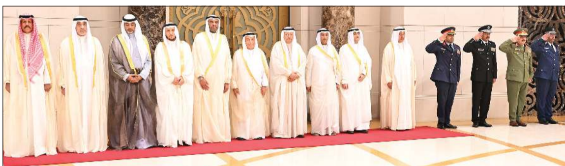
رئيس مجلس الوزراء بالإنيابة وزير الدفاع ووزير الداخلية الشيخ فهد اليوسف ونائب رئيس الحرس الوطني الشيخ فيصل النواف ووزير الديوان الأميري الشيخ محمد العبدالله ونائب رئيس مجلس الوزراء ووزير الدولة لشؤون مجلس الوزراء شريدة المعوشرجي ووزير الخارجية عبدالله الجحيا والمستشار محمد أبو الحسن والسفير أحمد فهد الفهد والفريق م. جمال الذياب والفريق الشيخ سالم النواف والفريق م. هاشم الرفاعي