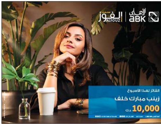
الفوز لهذا الأسبوع