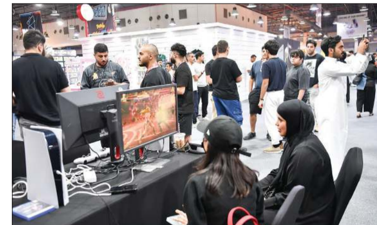
إقبال كبير على البطولة