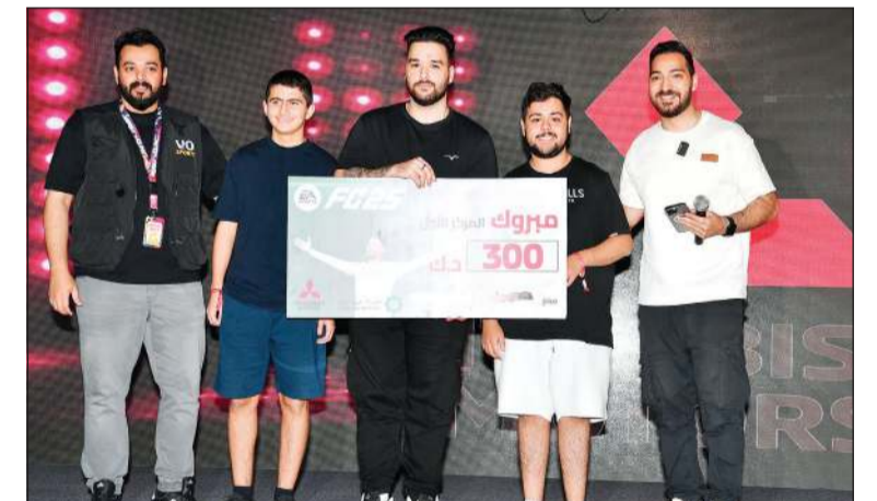
تكريم الفائز بالمركز الأول في منافسة FC25

دعم مواهبهم وأفكارهم وأنشطتهم التي يفضلونها. ولقد شملت الفعالية الهادفة عرضا لسيارة ميتسوبيشي الجديدة XFORCE المصممة خصيصا لفئة الشباب، والتي تشمل تصاميم رياضية وفريدة من نوعها المزودة بأعلى معايير التكنولوجيا والأمان لتلبية جميع احتياجاتهم. وتتميز ميتسوبيشي XFORCE بواجهة خارجية أنيقة ومهيبية تلفت الأنظار مع الشبك الأمامي الجريء والدرع الديناميكي وتفاصيل الخلية السداسية إلى جانب المصابيح الأمامية والخلفية LED على شكل T، مصممة بداخلية متطورة ومواجهة للتكنولوجيا تتضمن بإضاءة محيطية، وشاشة عرض رقمية للسائق بحجم 8 بوصات، وشاشة خاصة بـ Apple CarPlay و Android بحجم 12.3 بوصة، التي كوت مزجبا مثاليا من الأناقة والتكنولوجيا والراحة لركابها. وتتضمن XFORCE أربعة أوضاع قيادة متميزة - الوضع العادي، الحصى، الرطب، والطين - لضمان أداء سلس وموثوق على مختلف الطرق وأنظمة القيادة الذكية، كما وفرت XFORCE الرحابة في المقاعد الخلفية، ومساحة تخزين واسعة مع باب خلفي كهربائي، كما تتضمن ميتسوبيشي XFORCE أعلى معايير السلامة المتطورة.