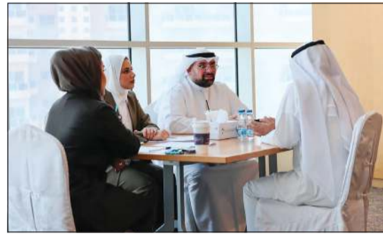
جانب من فعاليات يوم التوظيف