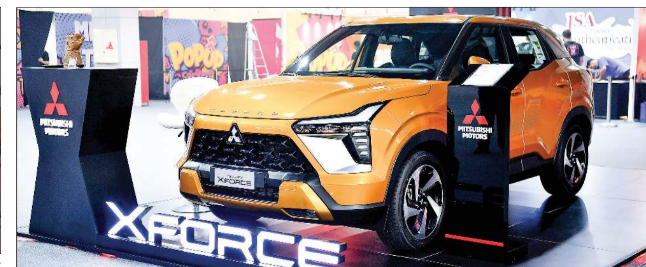
منتجنا الجديد لكم جميعا اليوم. قمنا بتصميم XFORCE حول مفهوم: «أفضل رفيق لحياة مليئة بالإثارة»، وهذا المفهوم يتجسد في 3 مكونات: «الإثارة»، «الراحة»، و«العملية». وقد قام العديد من أعضاء فريقنا بتكريس جهودهم لتطوير سيارة XFORCE الجديدة كليا، مع

شاركت شركة الملا موتورز - إحدى شركات مجموعة الملا والموزع المعتمد والوحيد لسيارات ميتسوبيشي موتورز في الكويت منذ عام 1972 - مؤخرا في فعالية Pop Up by Comfest التي تستهدف فئة الشباب من مختلف الأعمار، ونظمت لهم البطولة الثالثة للألعاب الإلكترونية الراجحة بين فئة الشباب، حيث تنافس خلالها أكثر من 200 مشارك ومشاركة من مختلف الفئات العمرية من الشباب والشابات في الكويت. كما تم عرض ميتسوبيشي XFORCE الجديدة كليا بتصميمها العصري الذي يناسب احتياجات الجيل الجديد وتطلعاته.