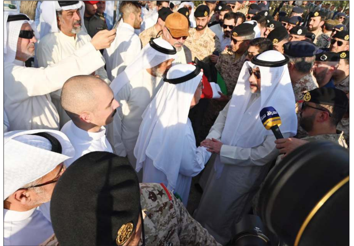
النائب الأول لرئيس مجلس الوزراء ووزير الدفاع ووزير الداخلية الشيخ فهد اليوسف يقدم التعازي إلى والد الشهيد النقيب طيار محمد محمود عبدالرسول