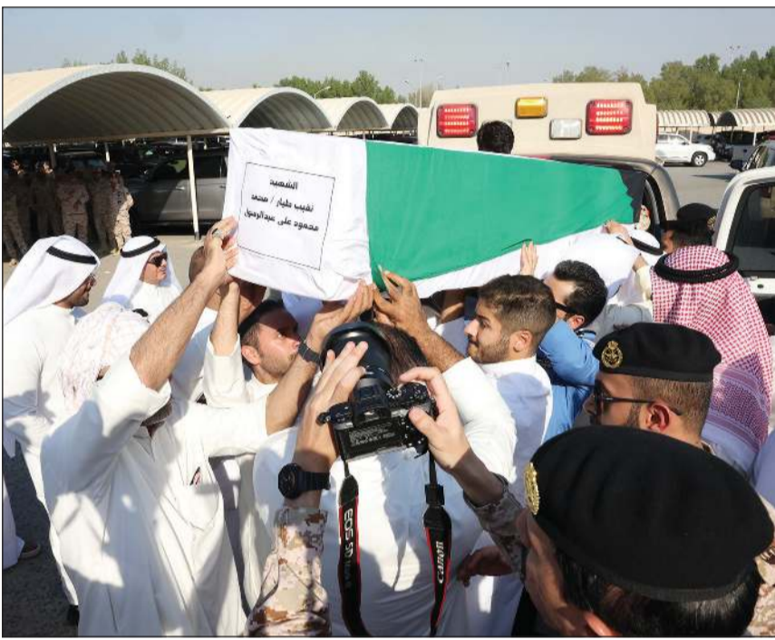
جانب من تشييع جثمان شهيد الواجب

شجعت الكويت عصر أمس شهيد الواجب نقيب طيار محمد محمود عبدالرسول في مقبرة الصليبخات، والذي وافته المنية عصر أمس الأول الأربعاء، إثر حادث سقوط طائرته الحربية (F18) أثناء أداء مهامه التدريبية شمال البلاد. وتقدم مراسم تشييع الحنازة العسكرية النائب الأول لرئيس مجلس الوزراء ووزير الدفاع ووزير الداخلية الشيخ