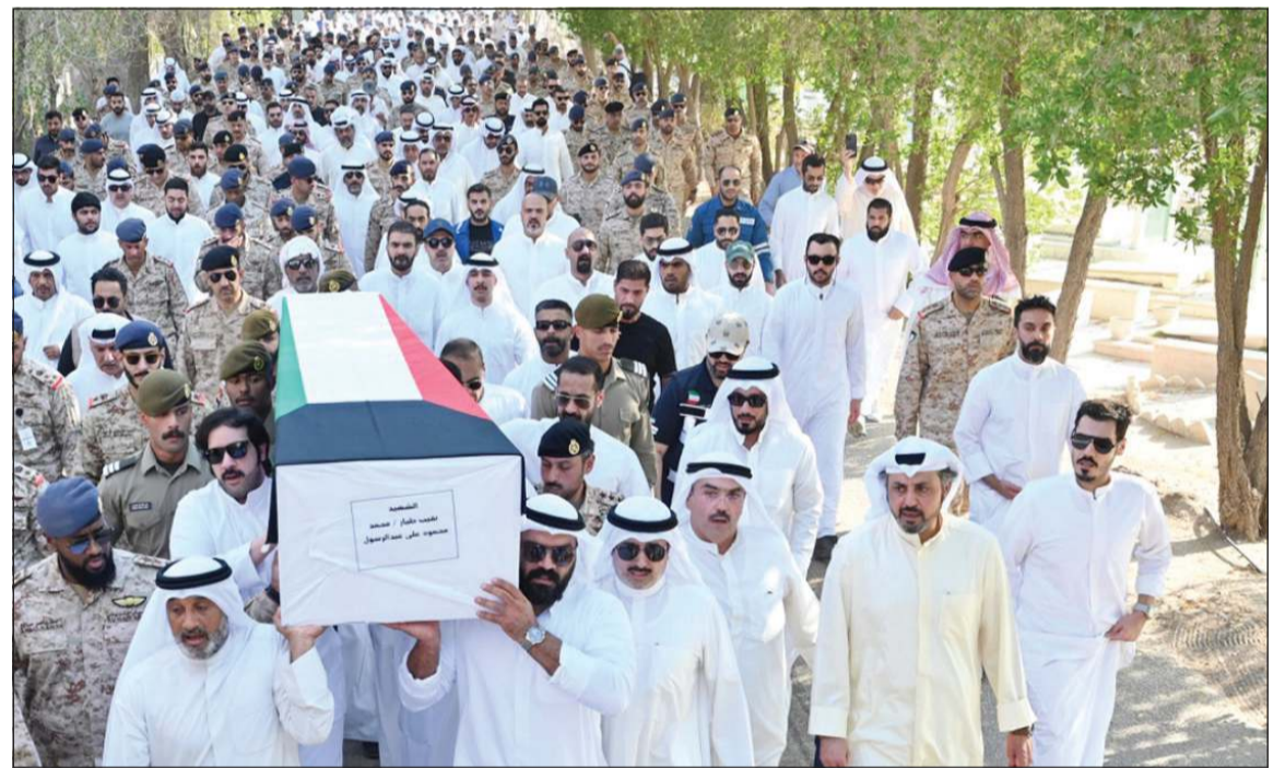
حضور كبير في تشييع جثمان شهيد الواجب