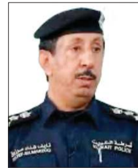
العميد نايف المطيري

لحادث يفقده أطرافه، وكانت عملية الاستدلال على هؤلاء الكويتيين الذين تجاوزوا من العمر 18 عاما ويحق لهم عمل البصمة البيومترية بلغ 976602 مواطنا، قام 945176 بإجراء البصمة خلال المهلة الممنوحة لهم، فيما تخلف منهم 31426 مواطنا، بينهم المتعثرين للخارج للدراسة والعلاج بالخارج ومرافقهم وأعضاء السلك الدبلوماسي في السفارات، حيث تم إيقاف بطاقات من لم يقم بعمل البصمة باستثناء الدارسين ومتلقي العلاج ومرافقيهم وأعضاء السلك الدبلوماسي، فيما بلغ عدد الوافدين الذين ينطبق عليهم شروط البصمة 2660766 و1937272 قام بعمل البصمة، فيما بقي 723494 البصمة، وأندا لم يقوموا بعمل البصمة، وستنتهي المهلة الخاصة بهم مع نهاية العام الحالي.