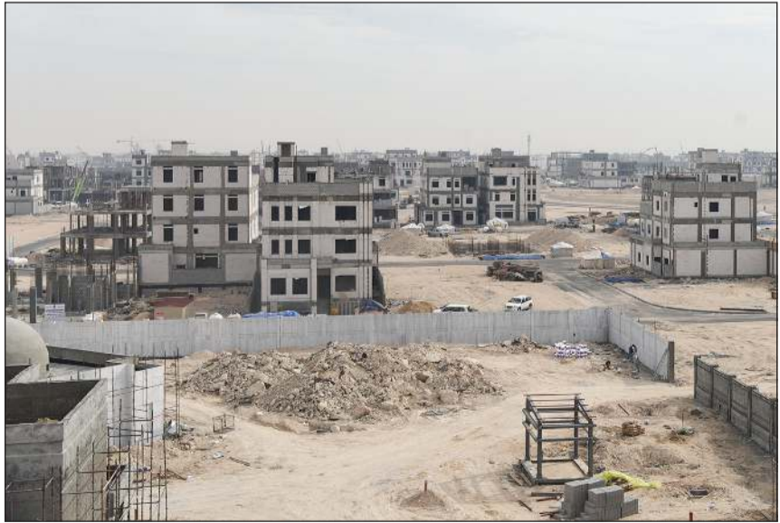
لقطة جماعية لممثلي هيئة أسواق المال والجمعية الاقتصادية خلال التوقيع

توقيع العقود في منطقة جنوب خيطان والخاصة بتطوير مجمع تجاري متميز. وقد أبرمت المؤسسة 7 عقود للانفتاح من الأراضي لإقامة فروع مصرفية للبنوك بإجمالي إيرادات متوقعة تصل إلى 291 ألف دينار سنوياً، ويجري العمل على طرح 4 مواقع أخرى في مدينة الوفرة السكنية ومنطقة شمال غرب الصليبخات ومنطقة غرب عبدالله المبارك. وذكرت المؤسسة العامة للرعاية السكنية أنها بصدد إبرام عقود انتفاع لثلاثة مواقع مراكز لإصلاح وصيانة السيارات في مدينة سعد عبدالله ومنطقة غرب عبدالله المبارك ومدينة جابر الأحمد بإيرادات سنوية متوقعة تصل لـ 441 ألف دينار. وأعلنت أن إجمالي التكلفة الرأسمالية للمشاريع التي تمت ترسيبها وبشراف عليها قطاع الاستثمار أبرمت عقوداً لتمويلها مع المستثمرين تبلغ نحو 424 مليون دينار، فيما تفوق إيراداتها طوال مدة الاستثمار المتفق عليها نحو 281 مليون دينار.