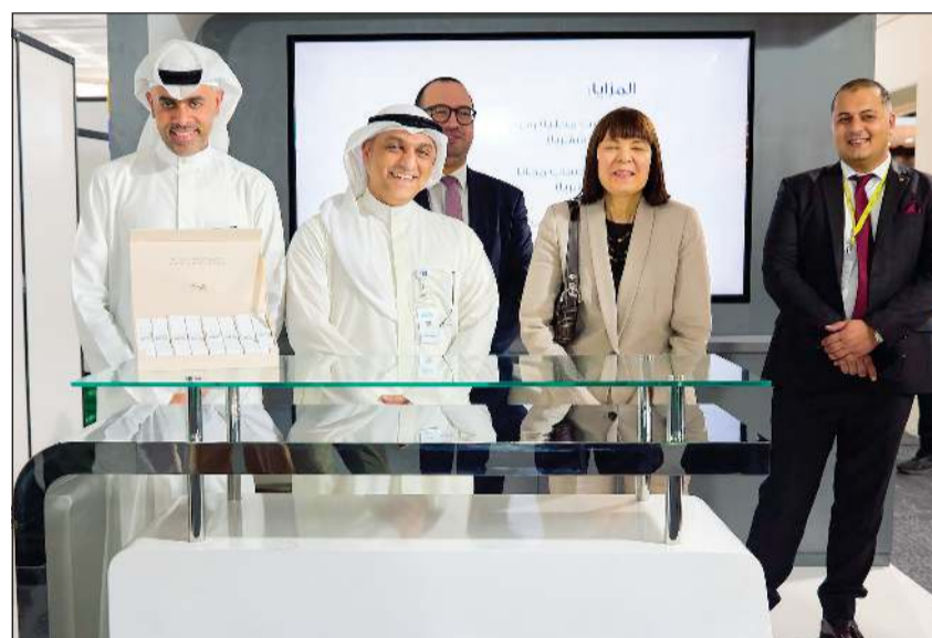
السفيرة الأميركية كارين ساسامارا في لقطة جماعية مع ممثلي البنك الأهلي

أعلن البنك الأهلي الكويتي عن مشاركته في معرض عالم السيارات للسنة الثانية على التوالي في أرض المعارض الدولية، حيث يعد هذا الحدث أحد أكبر معارض السيارات في الكويت، ويعرض مجموعة واسعة من الابتكارات في صناعة السيارات ويوفر منصة للعلامات التجارية المحلية والدولية للتواصل مع عشاق السيارات.