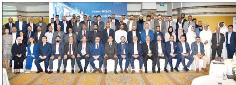
لقطة جماعية للمشاركين في فعالية «هاوي»

ركيزة أساسية لاستراتيجيات الأعمال وأولوية استراتيجية نظراً لدوره المحوري في دفع عجلة النمو والابتكار». وأضاف بالقول: «من خلال تبني استراتيجيات التحول الرقمي، يمكن للشركات والهيئات الحكومية في الكويت فتح آفاق واسعة للنمو، ومعالجة التحديات، والتكيف مع المتغيرات، وتعزيز كفاءة العمليات وجودة الخدمات». وسلطت هاوي الضوء خلال الحدث على حلولها القطاعية المتطورة التي تهدف إلى اغتنام الفرص ومعالجة التحديات الفريدة للقطاعات الاقتصادية الرئيسية في الكويت. ويشمل ذلك حلول هاوي للتعليم الذكي، والرعاية الصحية الذكية، والعقارات الذكية، والتمويل الذكي. وكشفت الشركة كذلك عن عروض شاملة للجهات الحكومية في الكويت تتضمن أنظمة المكاتب الذكية والشبكات المؤسسية وشبكات مراكز البيانات الخفيفة.