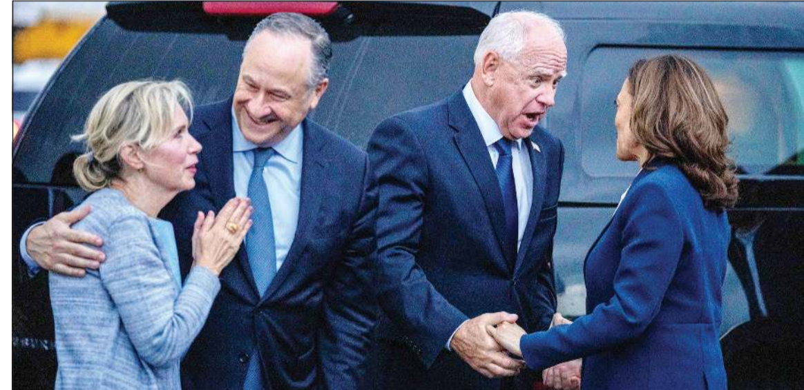
حاكم مينيسوتا تيم والز المرشح لمنصب نائب الرئيس مودعا المرشحة الرئاسية كامالا هاريس لدى عودتها إلى واشنطن بعد أول مؤتمر انتخابي في فيلادلفيا (أ.ف.ب)

عواصم - وكالات: لم يتأخر الرد من المعسكر الجمهوري على الهجوم الذي شنته نائبة الرئيس الأميركي والمرشحة الرسمية للحزب الديموقراطي كامالا هاريس برفقة نائبها حاكم مينيسوتا تيم والز في أول ظهور انتخابي مشترك لهما في فيلادلفيا بولاية بنسلفانيا، من حيث دشنا حملتهما. وقال مرشح الحزب الجمهوري دونالد ترامب لمرحلة «فوكس نيوز» أن: هاريس كانت سيئة للغاية لدرجة أنهم أرادوا قبل 5 أسابيع إزاحتها بعد تشكيكهم بنجاحها بالانتخابات. وقال ترامب ساخراً: والز نسخة أكثر ذكاء من هاريس وأنا مسرور باختيارها له. واعتبر أن «المناظرة مع هاريس مهمة جداً وستفضحها تماماً كما فضح بايدن» علماً أنه كان هناك خلاف بين هاريس وترامب على موعد المناظرة. فبعد أن أعلن ترامب في وقت سابق أنه اتفق مع شبكة «فوكس نيوز» على تنظيم مناظرة مع هاريس