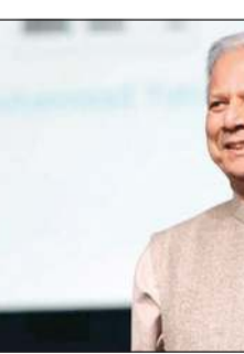
د. محمد يونس (انترنت)

البريطانية أمس أنه سيبدل كل ما في وسعه لضمان «تنظيم انتخابات حرة ونزيهة في الأشهر المقبلة»، وأنه ينبغي على الشباب «ألا ينشغلوا بنصفية الحسابات، كما فعل كثير في حكوماتنا السابقة». وكان رئيس بنغلاديش محمد شهاب الدين عين أمس الأول يونس لقيادة حكومة مؤقتة بعد حل البرلمان بناء على اقتراح اسمه من جانب مجموعة (طلاب ضد التمييز) التي قادت الاحتجاجات