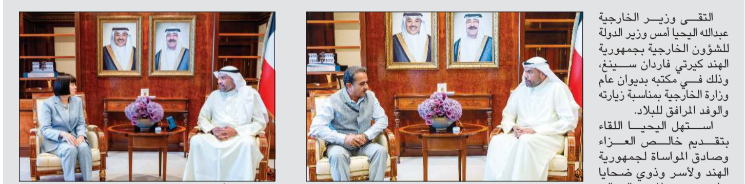
وزير الخارجية عبدالله الجحيا مستقبلاً وزير الدولة للشؤون الخارجية بالهند كيرتي فارदान سينغ، وذلك في مكتبه بديوان عام وزارة الخارجية بمناسبة زيارته والوفد المرافق للبلاد.

استقبل الجحيا اللقاء بتقديم خالص العزاء وصادق المواساة لجمهورية الهند ولأسر وذوي ضحايا حادث حريق المبنى العمالي في منطقة المنقف الذي وقع أمس الأول وللشعب الهندي الصديق. وأكد الوزير حرص حكومة الكويت على متابعة حالة المصابين وتقديم كامل الرعاية الصحية لهم وتسخير كل الإمكانيات اللازمة لتلبية احتياجاتهم الطبية، متمنياً للمصابين الشفاء العاجل، ومشهداً على أن الجهات المعنية في البلاد تقوم على أكمل وجه بعمل اللازم لمعرفة ملائسات ومسببات الكارثة المروعة، وأن العدالة ستأخذ مجراها في هذه القضية بكل شفافية ونزاهة.