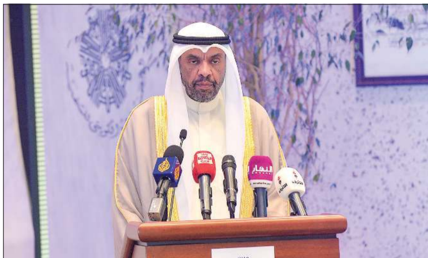
وزير الخارجية متحدثاً في احتفال يوم اللاجئ العالمي