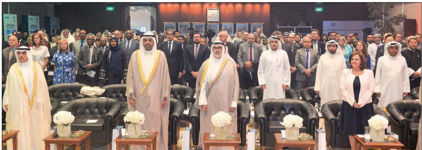
وزير الخارجية عبدالله الجحيا ونائبه الشيخ جراح جابر الأحمد خلال السلام الوطني في بداية الاحتفال (متين غوزال)