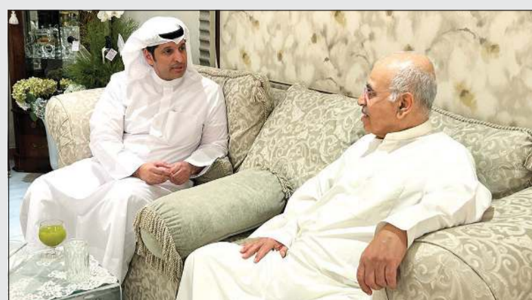
بعد أن زاره في منزله للاطمئنان على صحته