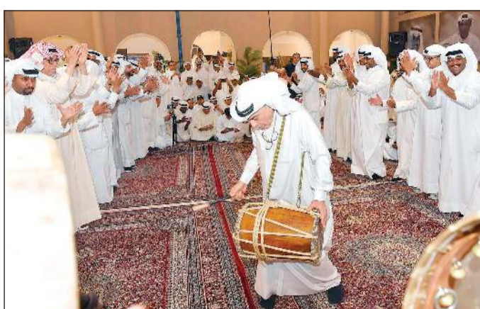
فرقة العميري الشعبية وأجوازها التراثية