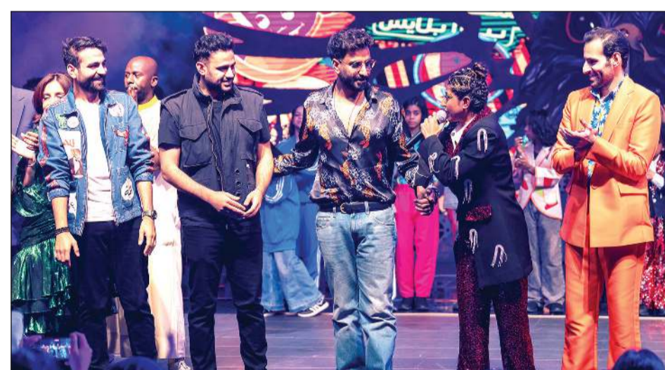
نجوم «صنع في الكويت» يرحبون بالنجم محمود بوشهري

البعض يرى انك استخدمت فكرة توزيع الجوائز وسحب على سيارة من خلال عروض بوراشد أنا طمعان فيك وأريد أن تقدم للإقبال على الحضور؟ ● وما المانع في ذلك؟ فهذا فكر تسويقي بحسب لي وليس علي، وشاهدت أن هذا الفكر وجد أصدا حلو مع الجمهور، وتلك الطريقة نجحت أيضا في أعمال أخواني عبدالرحمن الجيحوح ومحمد الحملي الذي بحسب لي أنه أول من قدم مثل هذه الأفكار وكلنا تعلمنا منه.